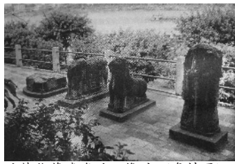
叶梦熊墓遗存的石像生（资料图）