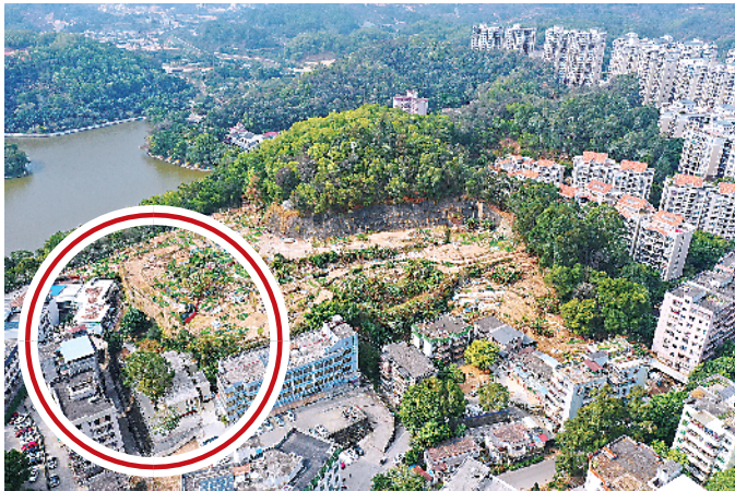
犹龙山航拍图，红圈标注为叶梦熊墓室大概方位

毁，是惠州历史文化资源的巨大损失。”惠州市博物馆退休文物专家郑成文如是感慨。 叶梦熊墓规模大、规格高，而且处于西湖风景区范围内。王宏宇建议，可结合惠州西湖风景区的规划建设，修复叶梦熊墓地：“这是惠州西湖非常重要的文物遗址，建议相关部门尽快推进墓园的修复建设。”