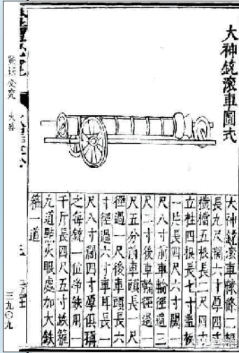
《登坛必究》中的“叶公神銃”炮车插图 资料图

在中国火器发展史中，明代出现一种车载炮叫“叶公神銃”。《武备志》中介绍：“叶公神銃”炮身用净铁打造，分天、地、玄三号。天字号神銃重 280 斤，长 3 尺 5 寸；地字号神銃重 200 斤，长 3 尺 2 寸，玄字号神銃重 150 斤，长 3 尺 1 寸。每炮有三轮炮车一辆，前有两轮，轮高 2 尺 5 寸，后面有一轮，轮高 1 尺 3 寸，前高后低，炮口昂扬。 这种炮，就是叶梦熊创制的。这种车炮的改进可谓创举。在此之前，戚继光所造的战车车身太重，“宜于守而不适于战”，而叶梦熊的车炮则轻便得多，往来便捷，“平地二人推之，险厄四人挽之，上列枪刀，中施火炮，又以所刀与长短兵相夹前冲，然后铁骑从之”，具有很强的实战性能。 这种火器不仅让叶梦熊在战事上屡建奇功，还成为晚明军事上克敌制胜的最有效武器。 当时“叶公神銃”被称为“将军炮”，有大将军、二将军、三将军之称，戚继光发明之前，便有将军炮一词，早期的将军炮指的是明代前期的传统大型火铳。神銃出现后，明人再提将军炮，便多指叶公神銃了。明朝后期，这类火炮的装备量很大，万历第二次援朝时，明军在兴兵初期调运的大将军炮便有 1244 门。