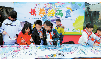
2019年桂城读书节上，小朋友们在绘画

羊城晚报讯 记者景瑾、通讯员杜建新摄影报道：1月19日，桂城街道召开“担使命向前，出实招见实效”乡村振兴工作推进会暨2019年度工作总结大会，对全年工作进行全面总结，并对2020年工作作总动员部署。记者从会上获悉，2019年桂城预计实现税收166.4亿元，增长3%，总量排名全区第一。全年落户桂城的超千万项目达196个，投资额超475亿元。全年民生投入占街道一般公共预算支出的84.35%。