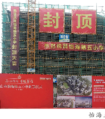
怡海五小喜封金顶

未来，保利和悦滨江的业主，不仅享有优先入读怡海五小的权利，还能享受保利和悦滨江专为业主打造的最具人文生活气息的精英学府社区配套。