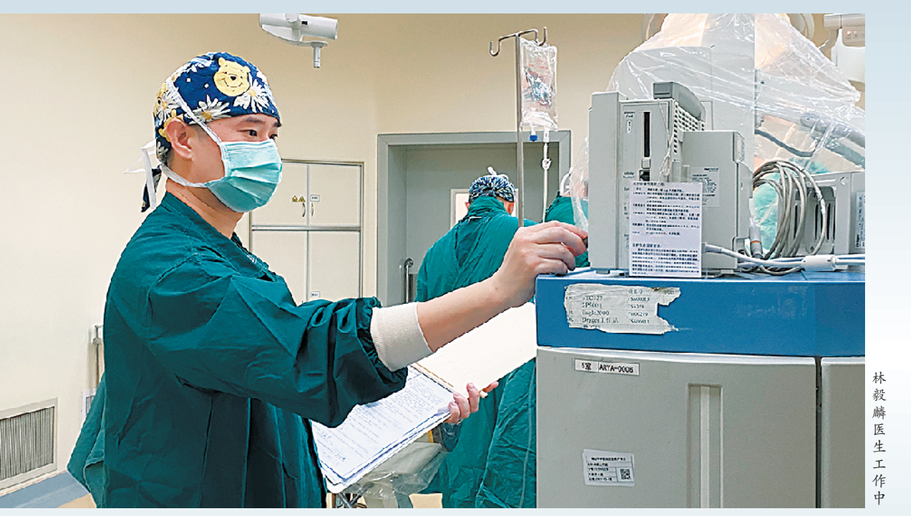
林毅麟医生工作中

羊城晚报讯 记者郑诚、通讯员张键怡摄影报道：近日，北京一名儿科医生在结束单位联欢表演后，边赶回医院手术边在车上卸妆的视频，在朋友圈热传，并获得《人民日报》点赞。在佛山，也有很多把病人安危摆在首位的医生。上周末，佛山市中医院举行的联欢晚会上，就有一名麻醉医生在临上场表演前5分钟受命支援急诊手术，他甚至来不及登台亮相，更没有拍下带妆照。