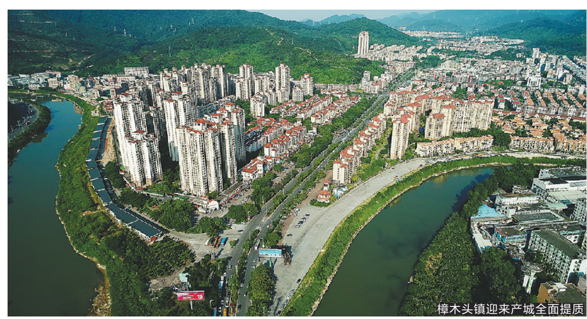
樟木头镇迎来产城全面提质

2019年,为了回应人民群众关心的学位问题,东莞市樟木头镇率先扩建新增学位1900个;针对群众关心的医疗卫生问题,该镇牵头成功创建“国家慢性病综合防控示范区”;经过不懈努力,石马河旗岭国考断面消除劣V类,实现达标。这些看得见的变化彰显着新气象。2019年以来,东莞市樟木头镇扎实开展“不忘初心、牢记使命”主题教育,认真贯彻“守初心、担使命,找差距、抓落实”的总要求,一体推进学习教育、调查研究、检视问题、整改落实四项重点措施,实现了“理论学习有收获、思想政治受洗礼、干事创业敢担当、为民服务解难题、清正廉洁作表率”的目标,达到了预期目的,取得了重大成果。全镇广大党员干部还围绕“工商并重、文旅并举、产城融合”发展战略,推动“十百千”全产业链倍增,全力以赴稳增长、促转型、抓改革、惠民生,全镇经济社会发展保持稳中有进、进中向好的态势,预计2019年全镇地区生产总值增长5.5%-6%。