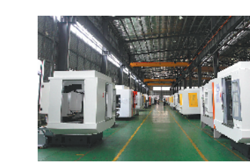
以先进制造业为代表的智能制造经济增长良好

不忘初心,方得始终。新的一年,樟木头镇将以踏石留印、抓铁有痕的作风和劲头,只争朝夕,不负韶华,进一步巩固和拓展主题教育成果,决战决胜全面建成小康社会,奋力推进治理能力现代化,以新担当新作为建设粤港澳大湾区品质城镇!