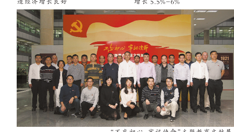
“不忘初心 牢记使命”主题教育文献展