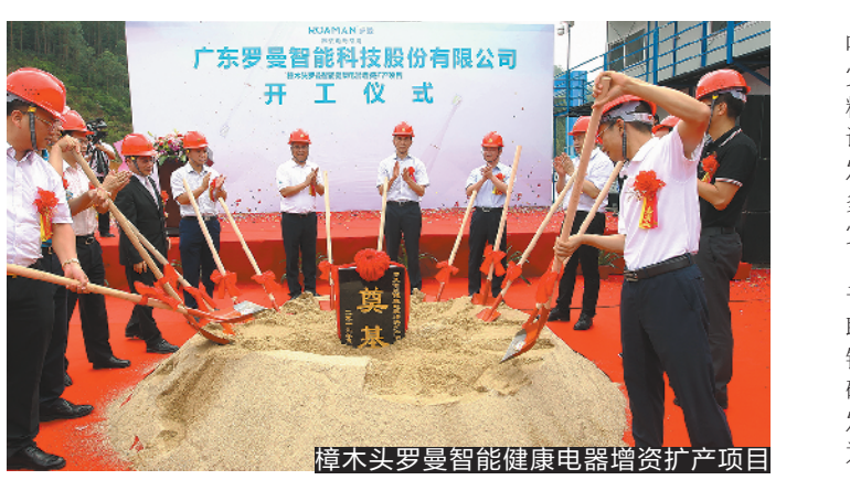
樟木头镇智能制造健康电器增资扩产项目

合唱系列爱国主义教育,观看《初心如磐赤子情》先进典型专题片,依托主题教育档案巡展、东纵纪念馆、将军楼、烈士桥等镇内外红色资源,深入开展革命传统教育、形势政策教育、先进典型教育和警示教育,不断增强学习教育的针对性、实效性、感染力。