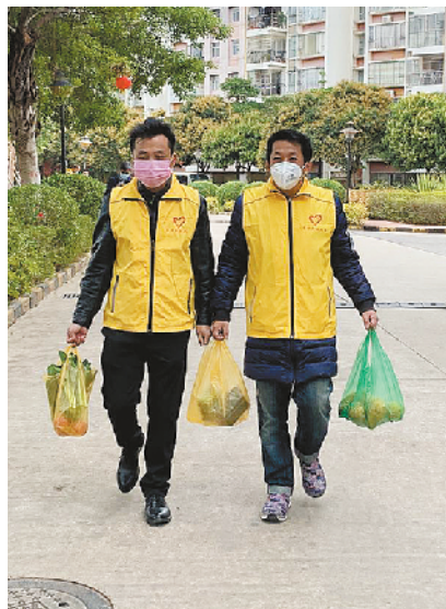
“辉哥”为隔离在家的业主送去蔬菜

每天市场上的肉菜品种不一样,并不能完全按照需求来买,前几次我们都在群里及时跟大家反馈,邻居们很客气,说我们看着办就行,对我们放心。对一些处于隔离期不便外出湖北籍邻居,我们都是将肉菜送到他们家门口,离开后再由户主自取。非常时期,大家互相帮助,一定能渡过难关。