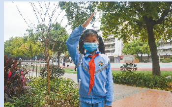
制作手抄报获回信的东莞小学生