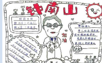
东莞小学生制作的手抄报