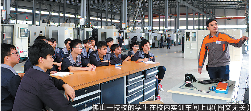
佛山一技校的学生在校内实训车间上课(图文无关)

技工院校应建立教师培训制度,定期组织教师参加国家、省和市的进修培训。没有行业、企业事业单位经历和经验的初任教师,任教专业课前应当到企业事业单位进行不少于6个月的实践锻炼。