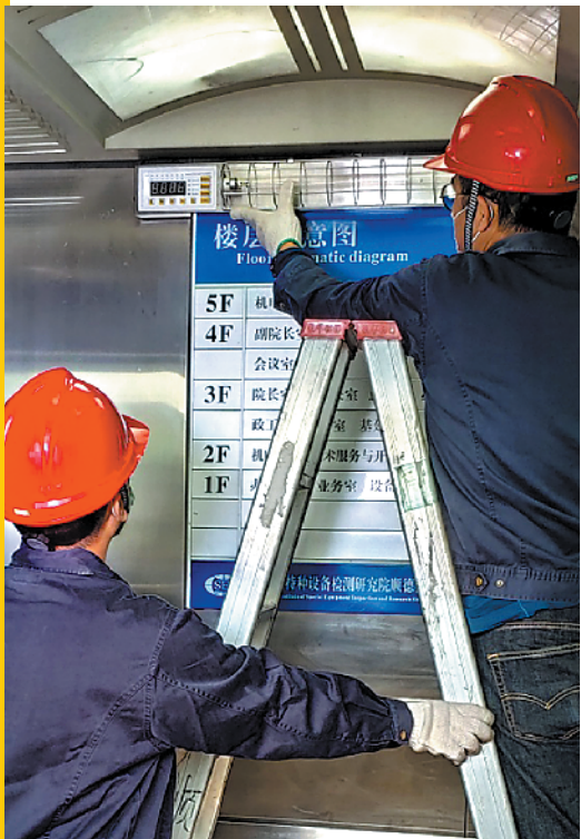
工作人员正在安装紫外线消毒系统

记者3月10日从顺德区市场监督管理局获悉,该局联合顺德特检院开发紫外线电梯智能消毒系统,该系统可根据不同场所预设工作时间,自动检测电梯无人状态后启动紫外线进行电梯消毒,能有效解决疫情期间电梯消毒的需求。目前,顺德区相关部门正对紫外线电梯智能消毒系统试运行情况进行进一步分析改良,并将逐步推广至医院、隔离留观点,甚至社会公共场所和社区、小区的电梯内应用。