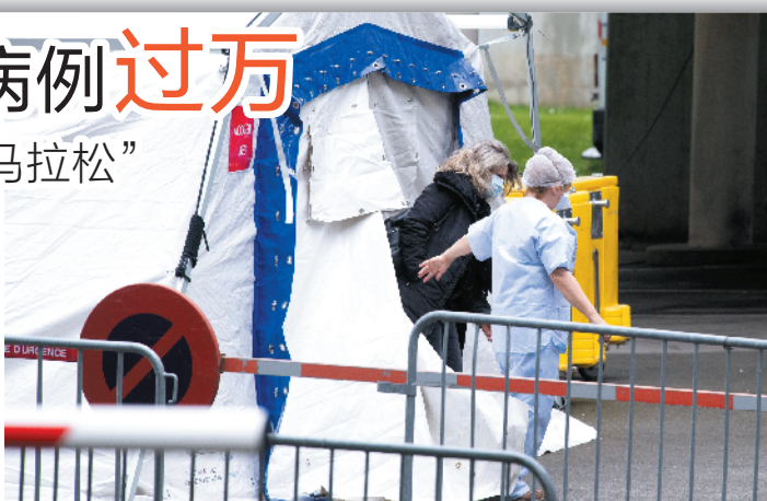
10日，巴黎医护人员和一名女子一起离开临时候诊室

据新华社电 欧洲新冠肺炎确诊病例10日继续攀升，疫情最严重的意大利确诊病例超过1万，全国进入“全境封城”第一天。同一天，一些欧洲国家采取暂停航班、强制隔离等有针对性的防控措施，严防疫情输入。更多欧洲国家决定停课、禁赛、取消大规模公众集会，以遏制疫情在各自境内扩散。