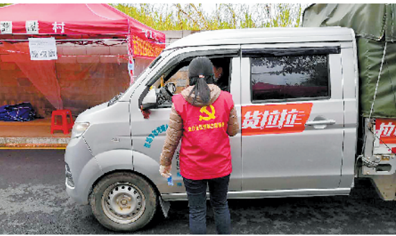
志愿者“请缨”做好社区疫情防控

自新型冠状病毒肺炎疫情爆发以来,坪山区坑梓街道金沙社区工作站与居民上下一心携手共抗疫情。特别是社区志愿者,主动“请缨”为防控疫情做力所能及的工作,成为社区抗疫一线上一道亮丽的风景。 社区作为疫情防控的基础和关键,担负着外防输入、内放扩散的重大责任。在金沙社区群防群控疫情的关键时刻,来自该社区