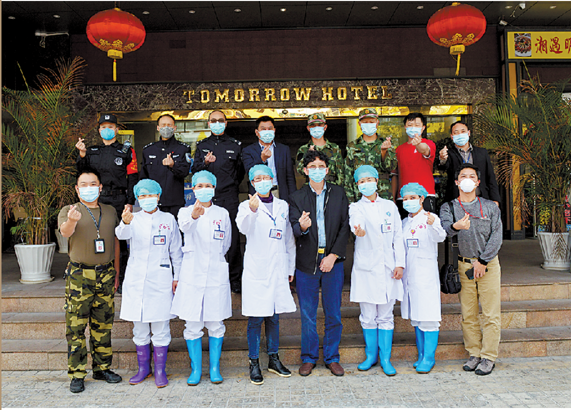
布吉街道“1号健康驿站”清零休站

这个返深人员临时安置点开站32天,共接待173人,隔离期间无一人出现发烧、咳嗽等症状