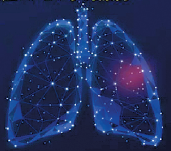
葛洲坝地产携手春雨医生线上免费咨询宣传图

快速提问时间：7*24 小时 专家值班时间：8:00-23:00 医疗资源丰富，呼吸内科、感染科 开放义诊，每人每天3次免费咨询