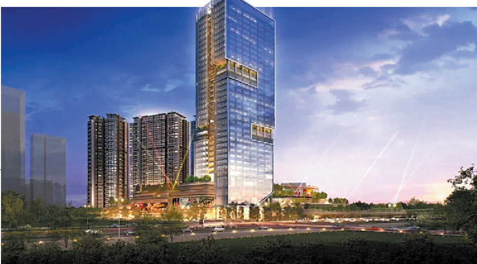
广州汉溪长隆发展项目规划打造成为城市地标式商住综合体

新世界中国行政总裁黄少媚女士说：“未来，新世界中国仍然将继续坚定自身的发展规划，加大对内地的投资力度，做好城市运营者的角色，打造新世界生态圈，构建繁荣安定、活力充沛的个性都会。”