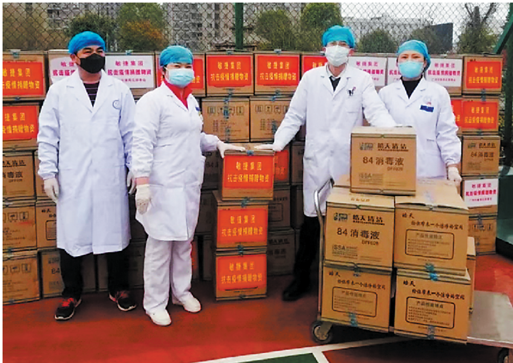
黄州区人民医院医护人员接收敏捷集团捐赠的紧缺医疗物资

疫情发生后，敏捷集团第一时间响应，累计捐款捐物合计1300万元，成立抗击新冠肺炎疫情基金。同时，紧急采购医疗物资送达武汉、黄冈、孝感、随州广水、荆州和广州等地的医院，持续为湖北和广东开展疫情防控工作提供实实在在的援助。