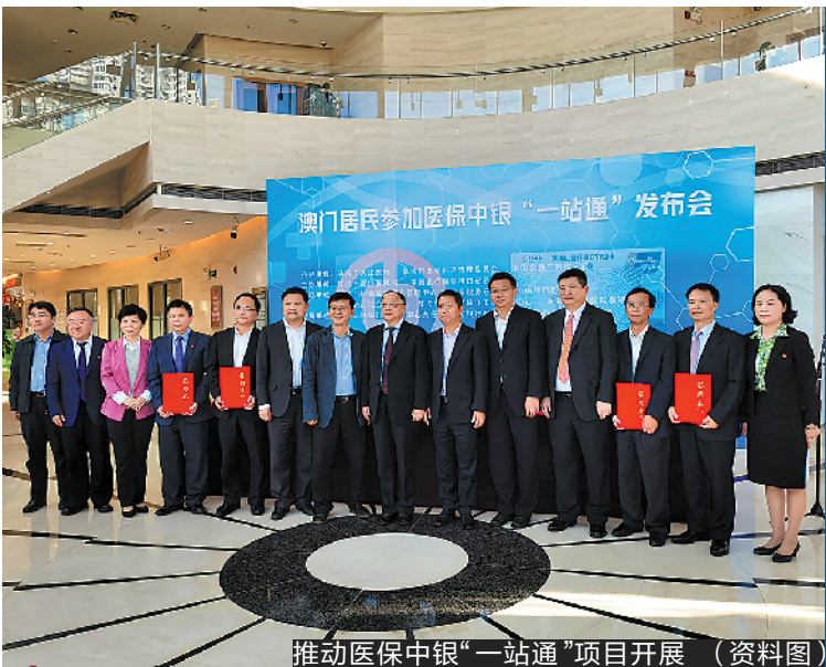
推动医保中银“一站通”项目开展（资料图）

为推动金融市场互联互通，人行珠海中心支行打出了一系列“组合拳”。一方面，借助广东金融资产交易中心平台推动跨境资产转让，并推动将持牌资产管理公司纳入银行不良资产跨境转让试点范畴。2019年以来，辖内银行依托该平台成功向境外转让不良资产223.01万美元。另一方面，构建与大湾区相适应的账户管理体系。2019年11月，指导中国农业银行珠海分行同步接入FT账户分账核算业务系统，开展FT账户分账核算业务。一年来，人行珠海中心支行还积极促进珠澳债券市场融合。