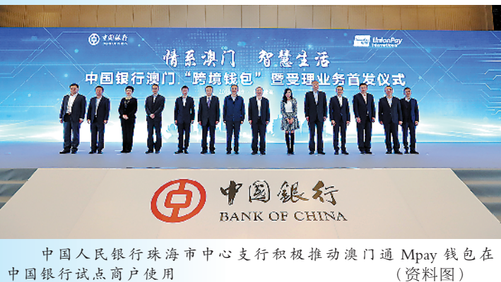
中国人民银行珠海市中心支行积极推动澳门通Mpay钱包在中国银行试点商户使用（资料图）

2019年3月，《规划纲要》印发实施，将珠海定位为港深、广佛、澳珠三大极点中的重要城市，并提出研究探索建设澳门——珠海跨境金融合作示范区。一年来，人行珠海中心支行以横琴为主平台，建立健全工作机制，加强金融创新及服务意识，促进珠海实体经济高质量发展，推动珠澳金融合作走出“新路子”。