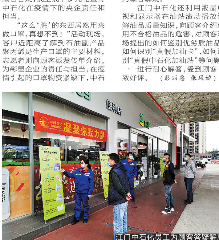
江门中石化员工为顾客答疑解惑