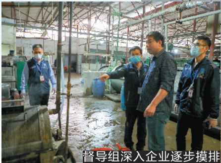
督导组深入企业逐步摸排

3月14日上午,省生态环境厅厅长鲁修禄到东莞长安镇实地调研了茅洲河流域整治工作。据了解,经过一年多的整治,茅洲河共和村断面水质取得重大突破,从2019年11月起水质由劣V类好转至V类。目前,茅洲河流域7个在建工程已全面复工,进入“最后一米”攻坚战。