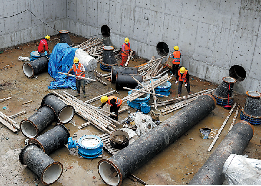
茅洲河二期项目的补水泵站工程施工现场