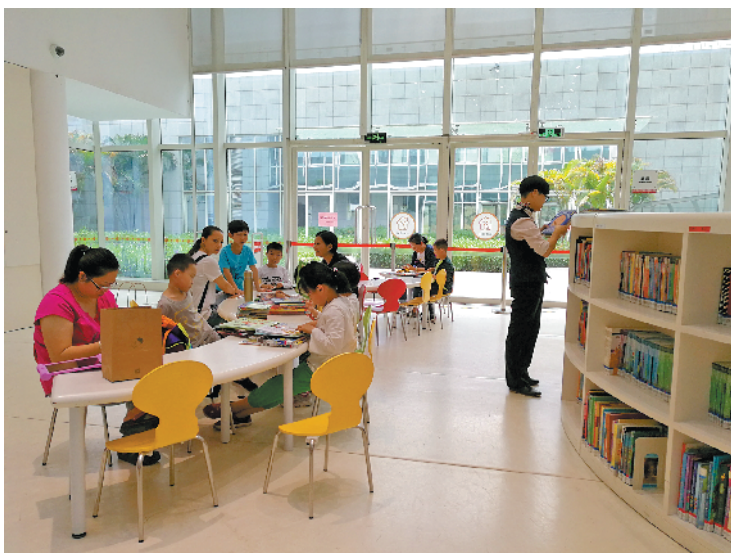
佛山市图书馆少儿阅读区

在馆人数不超过100人；祖庙路分馆每天接待300人，同时在馆人数不超过50人。达到同时在馆人数上限后，将采取“出一进一”措施限流。读者可登录佛山市图书馆微信公众号或佛山文化云登记预约。入馆时，凭预约成功的页面或短信在入馆门口验证；凭健康码或佛山电子通行证验证，显示绿色或蓝色方可通过；配合检查人员进行测温，体温正常且佩戴口罩者可入馆；禁止携带酒精等易燃易爆物品入馆。 据佛山市图书馆方面介绍，对于读者较为关心的违约问题，依据规定，读者借阅的文献在恢复开馆后1个月内归还的，无论什么时候外借的文献，如有逾期，系统将自动免除过期违约金。在恢复开馆1个月截止日期后归还的，如有逾期，将从实际借还逾期日期开始计算违约金，不可免除活动期间的违约金费用。 目前，佛山市联合图书馆339家成员馆已在按计划逐步、有序恢复对公众开放中。在各馆恢复开放之后的一个月，读者归还文献时均不会产生新的违约金，读者证账号上的逾期违约金请咨询佛山市图书馆及各区图书馆处理。