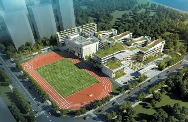
西江新城东片区学校建成效果图

羊城晚报讯 记者欧阳志强、通讯员陈仕杰摄影报道：随着西江新城建设推进，高明区西江新城东片区学校的项目推进备受社会关注。近日，项目进展传来新消息，《西江新城东片区新学校装备购置方案》顺利通过专家组论证。 记者了解到，西江新城东片区学校选址于明国路以北、西江大道以南，万科西江悦以东地块，规划为公办九年一贯制学校，设54个班，可以容纳在校生2520人。其中，小学36个班1620人，初中18个班900人。 学校项目占地面积67.53亩，总建筑面积5.4万平方米，总投资约2.65亿元，按照省标准化学校的要求进行设计和建设，配置教学楼、综合楼、食堂（含运动场）、学生宿舍（含地下停车场）、户外运动场地（标准田径场、篮球场、游泳池等），力争建设成为广东省县域教育综合改革的标杆性学校。 在功能场室设置方面，学校将按办学规模建设小学教室36间、中学教室18间。此外，还会配备一批理、化、生等学科实验室，音乐美术舞蹈教室、多功能远程教室、电子阅览室、报告厅、室内球馆等功能丰富的场室。同时，设置师生饭堂、宿舍等生活配套。