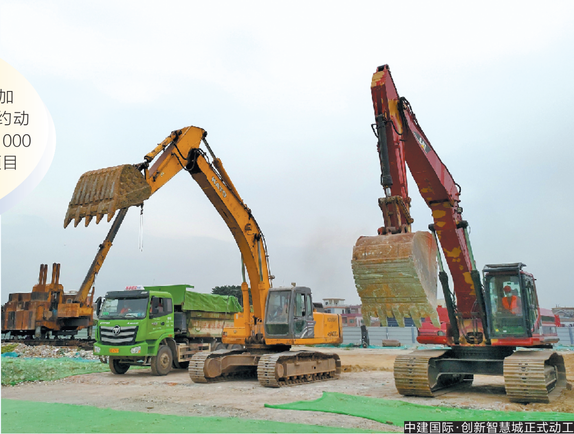
中建国际·创新智慧城正式动工

羊城晚报讯 记者张韬远报道：3月17日，记者从顺德区获悉，今年上半年该区将有一系列大型基础设施项目动工，包括医疗、交通与体育方面的基础设施。其中在中心城区修建的两座大桥，以及城市内环线建设将为顺德中心城区的交通改善发挥着积极作用。 今年上半年，顺德将有不少交通设施将迎来动工，其中包括新增两座连接顺德中心城区大良及容桂的大桥，这两座大桥的落成将有效改善顺德中心城区的交通情况。据了解，其中顺通大桥位于糖厂西侧，将建设跨江大桥，从大良金沙大道起桥，跨越容奇水道，南接容桂大道，全长约2.42公里。另一座顺兴大桥在顺德港东侧，建设北起大良南国东路与德胜东路交叉点（即五沙大桥大良岸引桥桥底处），向南跨过容桂水道的跨江大桥，南接容桂外环路，全长约2.62公里。 此外，顺德内环项目也将为顺德中心城区的交通改善起到不小的作用。据了解，为实施强中心城市形态提升三年行动