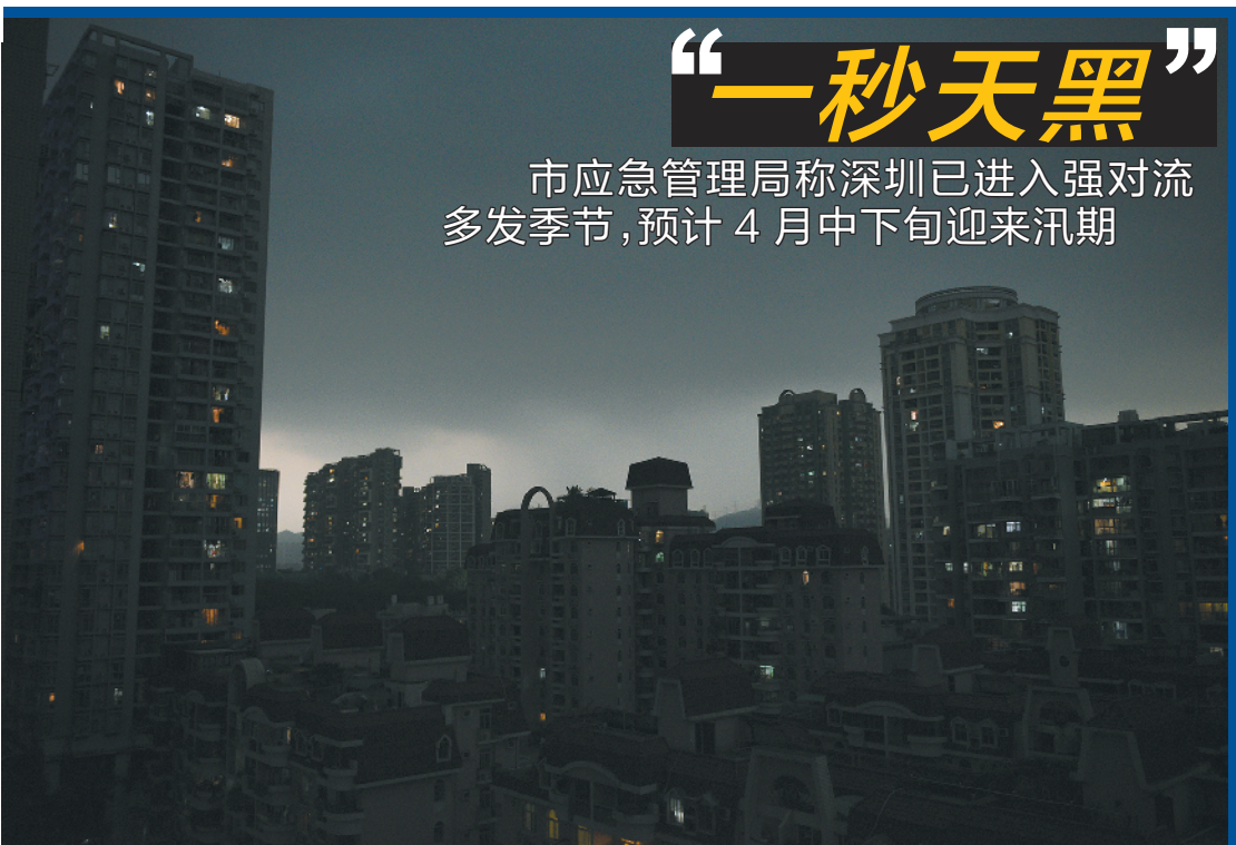
福田区昨日10时出现白昼如夜景象

征求意见稿认为,本项目是非污染生态影响工程,对环境的影响主要集中在施工期,经采取有效的环保措施后,污染物排放浓度和排放量可得到有效控制。从环境保护的角度出发,深圳湾航道疏浚工程(一期)的建设是可行的。