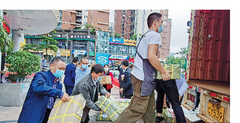
公益活动物资送达武汉

3月20日,龙华区教育局与中国农业银行深圳龙华支行“共植许愿树·助力武汉”公益活动收官。21日上午,此次公益活动购置的防疫物资顺利抵达武汉。