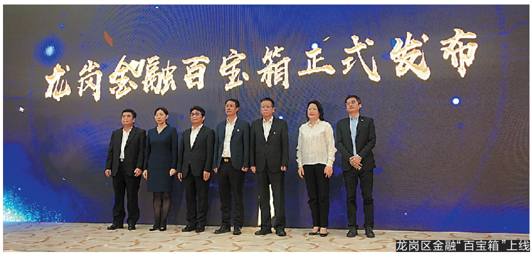
龙岗区金融“百宝箱”上线

3月20日,龙岗区举办“银”暖万企,“行”在龙岗——深圳金融业战疫之“龙岗·智造”专场活动,龙岗区与4家银行开展战略合作,合计提供2000亿元投融资意向信用支持,同时在全市首发龙岗区金融机构“战疫”专项信贷产品——“百宝箱”,共享40家金融机构140余款抗疫复工专项金融产品,12家金融机构现场签约授信6.77亿元,加强金融服务实体经济力度,帮助受疫情影响企业渡过资金难关。