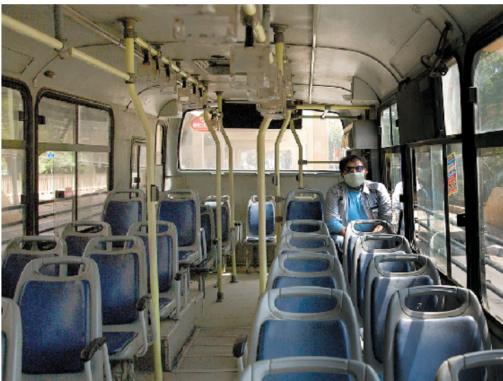
25日,一名售票员坐在没有乘客的新德里公交车里

据新华社电 印度总理莫迪24日晚发表电视讲话,宣布从当天午夜起在全国范围内实施为期21天的“封城”措施,以遏制新冠肺炎疫情蔓延。莫迪说,实施“封城”措施期间,“每个村庄和每条小巷都将严格实施封锁”。他要求民众取消一切社交活动,除购买生活必需品等特定情况外一律不要外出。