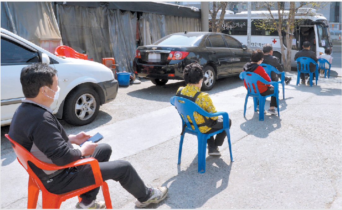
25日,韩国大邱民众保持间隔排队等待进入献血车献血

韩国青瓦台24日晚发布声明说,特朗普与韩国总统文在寅通话23分钟,希望韩方协助美国抗疫,并承诺帮助韩国制造商