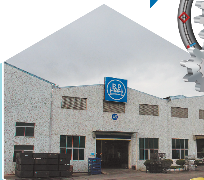
BPW(梅州)车轴有限公司满负荷生产