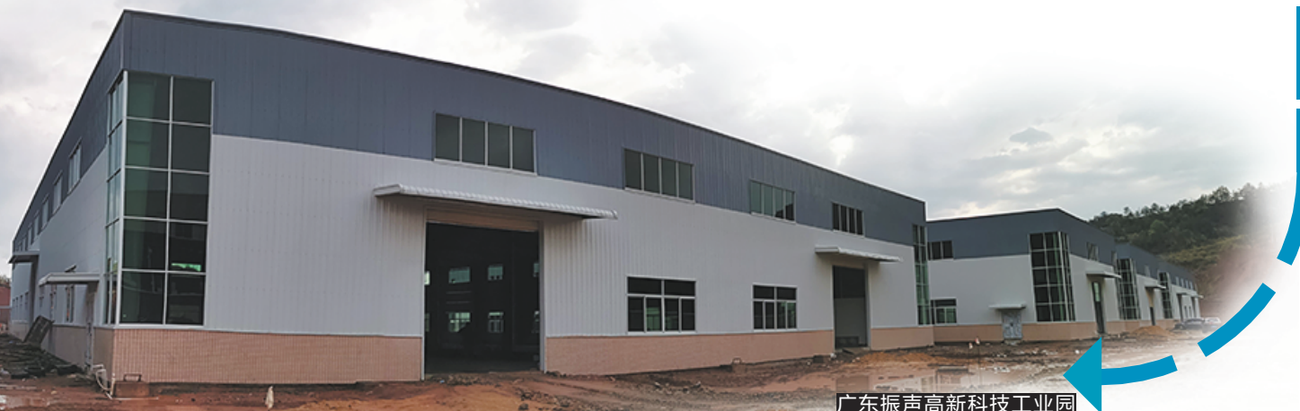
广东振声高科技工业园