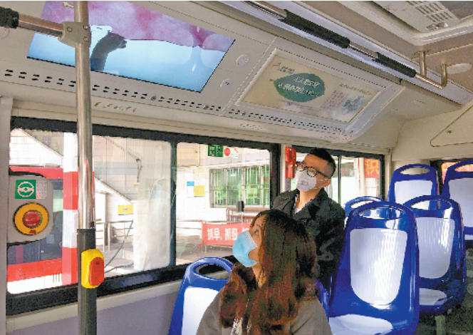
乘客在乘坐公交时观看《交通人的坚守》一心战“疫”公益视频

同时，佛广集团表示，希望通过这样的方式，向这场战“疫”中勇敢的交同人致敬，感谢他们为护送市民乘客的平安出行，在平凡的岗位上做出了一件件不平凡的事情。