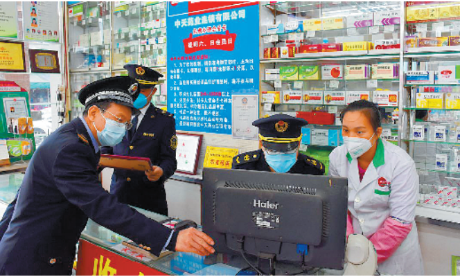
执法人员检查药店疫情防控工作

值得一提的是，疫情暴发时恰逢春节假期，部分企业表示因人手紧缺，无法兼顾日常药品管理和防疫工作，或存在不熟悉系统操作等问题。为解决企业疑难、帮助企业做好复产工作，区市场监管局发布《致药店的一封信》《关于加强新冠肺炎疫情防控期间零售药店管理工作的通知》，转发系统使用说明书以及操作规程，并通过政企交流群及时回应企业的疑难咨询。此外，派出工作人员到店检查、现场辅导，及时核查企业数据是否上传、信息是否正确登记，给企业做好登记工作吃下“定心丸”。