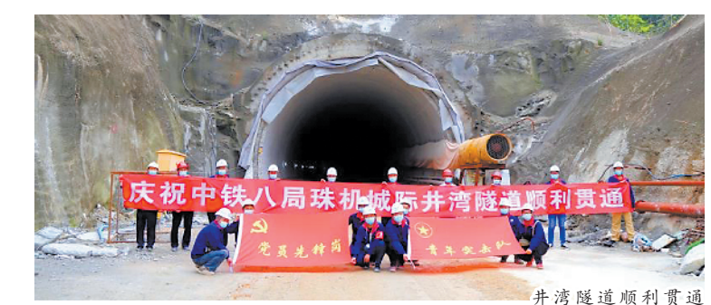
井湾隧道顺利贯通

羊城晚报讯 记者郑达、通讯员孟庆虎、侯力文、寿春苗摄影报道:4月1日上午9时28分,在井湾隧道施工现场,随着最后一声爆破声响起,隧道出口处被炸开,至此,珠机城际二期工程首座隧道——井湾隧道顺利贯通。 由中铁八局集团承建的珠机城际轨道交通井湾隧道位于珠海市横琴新区,是珠三角轨道交通网的重要组成部分,同时也是一条兼顾城市轨道交通功能的城际铁路。隧道为单洞双线形式,全长398米。 该隧道为双线隧道,断面大,洞内施工交叉作业相互干扰因素多,地质构造复杂,进出口局部存在花岗岩不均匀风化的危岩、落石。严峻复杂的地质情况为隧道开挖增加了相应的施工难度,这些不利因素对中铁八局建设者是挑战,