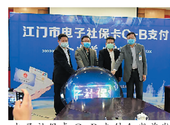
电子社保卡 C-B 支付全省首发

羊城晚报讯 记者陈卓栋、通讯员江人宣、谭耀广摄影报道:从医院扫码收款变为市民扫码支付,江门电子社保卡这一步走在全省前列。记者4月1日从江门市人社局获悉,经过江门市人社局与江门市中心医院合作,对接电子社保卡接口,江门市电子社保卡在全省率先开通“C—B”扫码支付服务新模式。 据介绍,电子社保卡缴费的“C—B”模式属于省内首创,与常见的由市民出具电子社保卡二维码“B—C”模式(即人工智能POS机扫描电子社保卡二维码完成付款)相比,“C—B”模式依托“五邑人社”微信小程序,医院出具可同时支持电子社保卡、银联、微信、支付宝等多种支付渠道的聚合二维码。市民依托“五邑人社”微信小程序可根据实际情况发起扫码操作,选择更灵活、支付更快捷、体验更舒畅,最大限度减少疫情期间人员接触与聚集。 记者了解到,市民通过“五邑