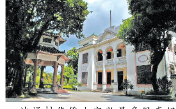
沙涌村华侨宅数量多保存好

羊城晚报讯 记者林翎、通讯员曾珺摄影报道:中山南区沙涌文创街区建设第一次工作会议日前召开。会议由南区党工委书记郭渊主持,来自羊城晚报报业集团、中山广播电视台、中山华侨城实业发展有限公司、珠海市唐家湾“唐家古镇”品牌及禅意发展(珠海)有限公司等省、市媒体代表和行业专家参会。 南区沙涌村是广东著名的华侨古村,南宋1203年建村,至今已有800多年历史。村内留存宋帝昀故里牌坊、文笔塔、文昌阁、南源堂等大量的历史古迹。沙涌村华侨众多,村内更保存了80多座清末民初的华侨老屋。沙涌历史文化街区更被列为“国家级历史文化保护街区”。 与会专家就沙涌文创街区规划设计、产业发展和侨房保育活化进行交流探讨,并一致认为,沙涌村华侨宅数量众多且保存完好,深具历史研究价值和文化遗产发展潜力。