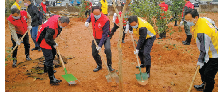
江门四套班子领导及市直机关工作人员进行义务植树

羊城晚报讯 记者陈卓栋、通讯员周颖森、谭耀广摄影报道:江门今年计划义务植树300万株。4月1日,江门市四套班子领导带领市直机关工作人员和江海区代表300多人,在江海区睦水道边礼乐桥底段优美科信新材料有限公司侧开展全民义务植树活动,同时蓬江区、新会区、台山市、鹤山市也开展了机关干部职工义务植树活动,在全市掀起植树高潮。 记者了解到,当日义务植树的地点位于江海区礼乐河道边。去年以来,江门市及江海区致力在礼乐河道开展林网修复工作,原本违建林立的河道两旁,经过清理后种上了大片落羽杉、水松等林木,逐渐恢复生机。在当天的义务植树活动上,1500株国庆花、桂花、凤凰木、紫薇、黄风铃木等苗木经过工作人员的扶直、培土、浇水后,纷纷树立起来。 江门市自然资源局人士表示,近年来,江门市以国家森林城