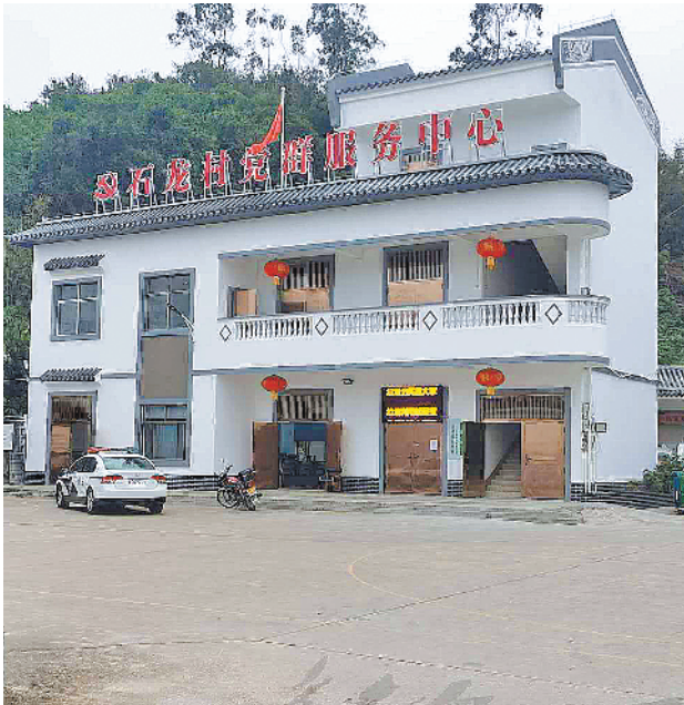
石龙村党群服务中心

在绿化提升方面，斗门将按照一村一绿景，一村一特色的原则进行村内绿化提升，根据各村的特色结合村民的意愿，选取适合本土种植的开花植物，打造连片的花海长廊，通过连片植物种植打造乡村美丽景观，丰富农村旅游资源。