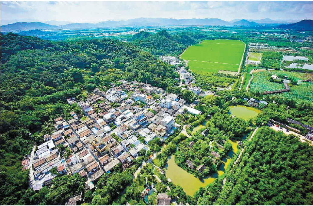
斗门乡村发展正在蝶变当中

在道路提升方面，10 条乡村振兴样板村的村内主干道将按照“四好农村路”标准，进行提升建设。对历史、旅游资源明显的村，可按照高标准景观路的标准进行高标准提升改