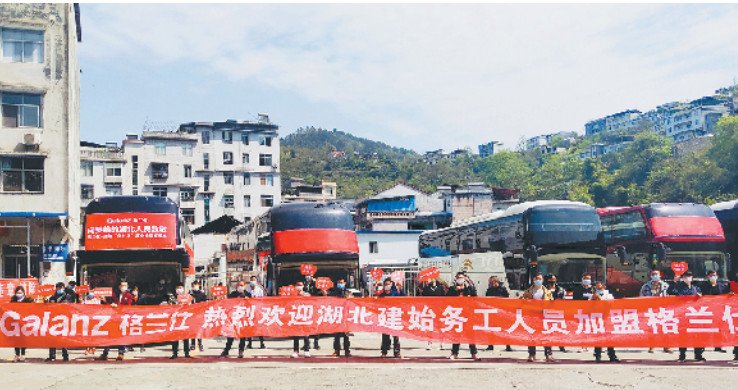
来自湖北的务工人员即将出发到顺德

推进孵化佛山本土的 KOC 乡村网红或私域流量达人,也是专委会今年的重要行动之一。通过新时代文明实践中心合作,落脚到镇街、社区一级,孵化众多“小圈子”内的网红或者乡村达人,让传播影响力更下沉,更真实有效。