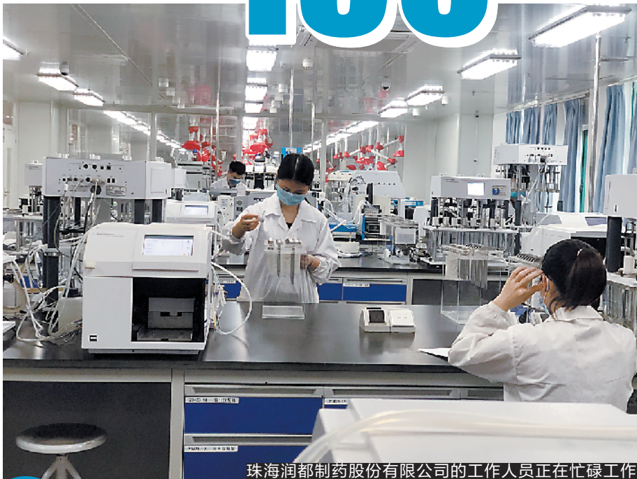
珠海润都制药股份有限公司的工作人员正在忙碌工作

据悉,截至3月25日,珠海今年以来新签约一亿元以上的重点项目达到31个,涉及签约金额286.6亿元;超过10亿元的项目有7个,优于去年首季度的项目签约情况。同时,珠海市1月至2月实际吸收外资3.66亿美元,同比增长127.3%,整体实现逆势增长。今年,珠海招商引资工作目标力争新引进超亿元重点项目130个,签约金额1000亿元。