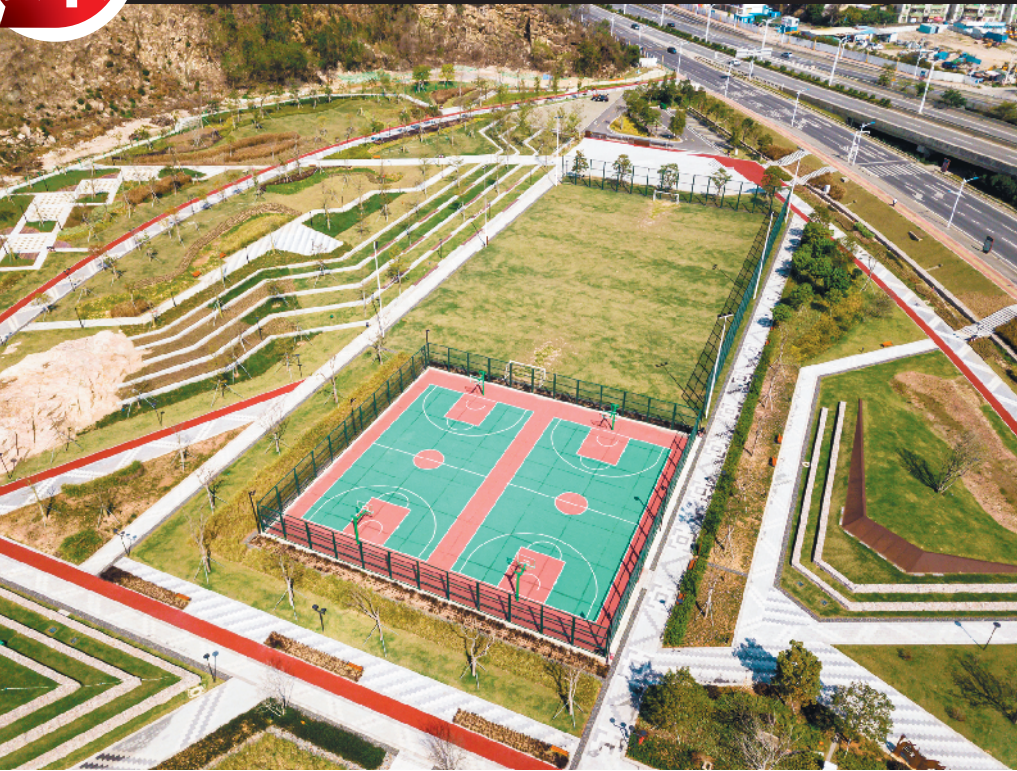
白藤山生态修复湿地公园