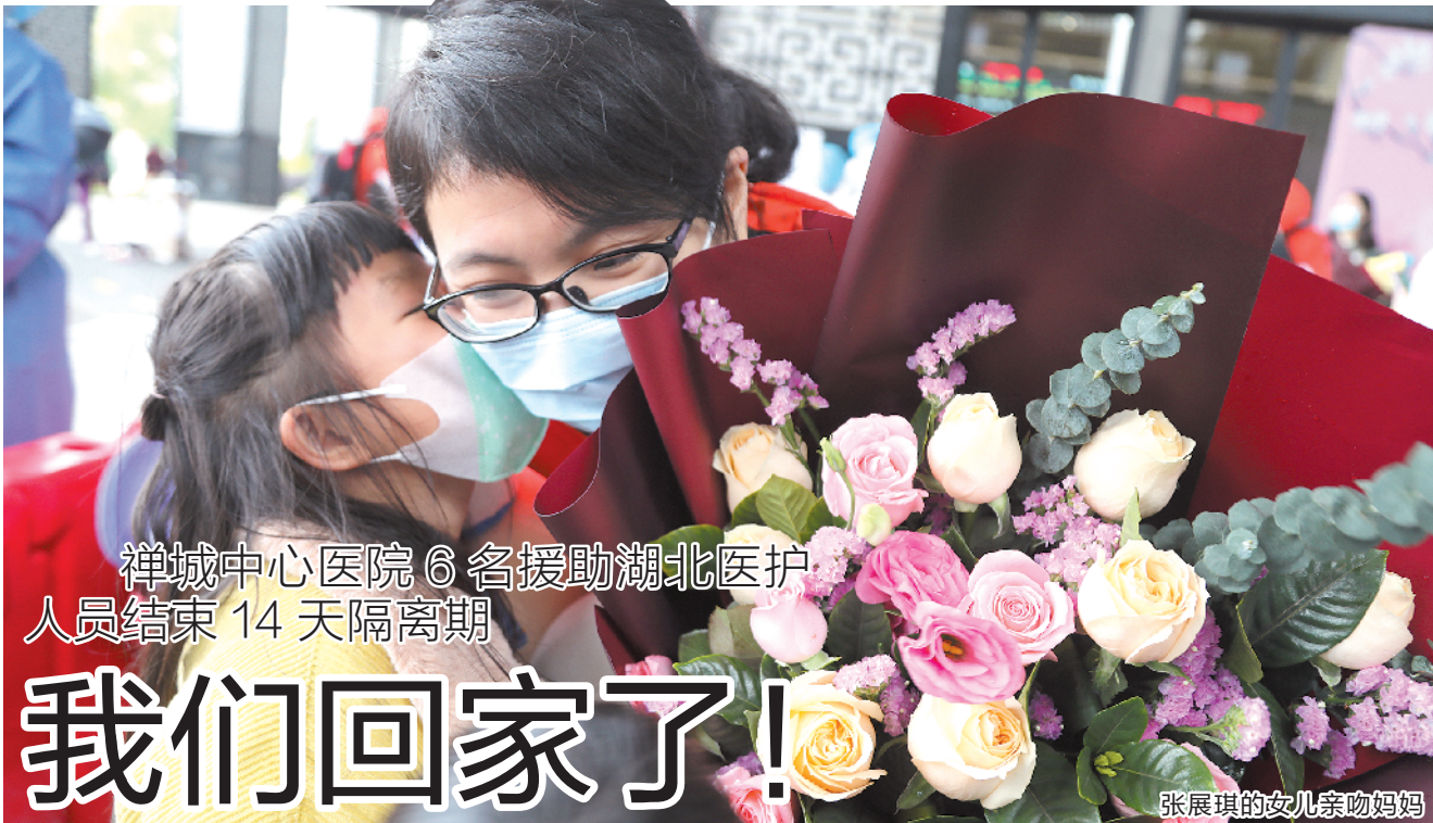
禅城中心医院6名援助湖北医护人员结束14天隔离期

首届设计大赛获奖作品成功孵化和公众号展示形式,线上线下同步面向公众投票,其中公众投票得分占30%,专家评审得分占70%,选出30个人围作品进入决赛。复评由专家评审团现场评选出获奖作品。其中,30个晋级作品(两个类别各15个晋级名额)参赛者或队伍将受邀到西樵进行为期五天的训练营,继续深化比赛作品。据了解,第一届大赛获奖概念作品成功孵化,包括印有西樵龙狮图案滑板、西樵“地标”建筑的钥匙扣等。