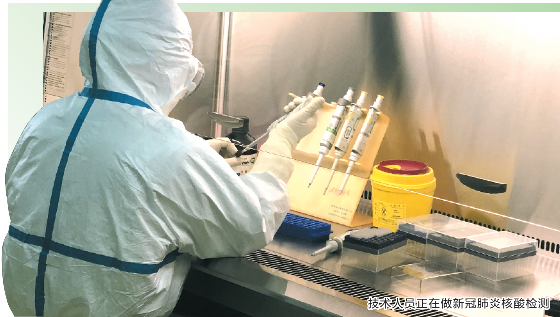
技术人员正在做新冠肺炎核酸检测

据了解，今年1月以来，为全面做好新型冠状病毒感染的肺炎疫情防控工作，佛山市检察院牵头与佛山市公安局联合建立了公检信息实时通报机制、当日提前介入机制、快速办理机制、特殊情况直诉机制等。同时，佛山市检察院及时在全市两级院设立涉疫情防控检察业务指导工作领导小组和办公室，将所有业务部门均纳入工作范畴，实现刑事检察、民事检察、行政检察、公益诉讼检察全面动员，全力投入疫情防控阻击战。