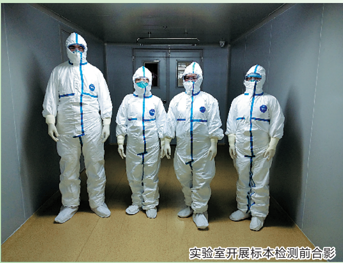
实验室开展标本检测前合影

但是早一分检测出病毒，就能早一步拦住病毒的传播。我们必须要以最快的速度“揪”出新型冠状病毒，让病人早一步得到治疗，为防止疫情传播争取时间。我们只能克制住心里的害怕，朝着病毒冲上去。在前期的培训中，处理样本、到PCR机上、高压灭菌……一个步骤不留神，可能就会感染上病毒，我们必须清楚地记得每一个步骤，一点儿错