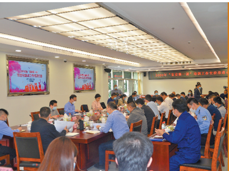
宝安第一课今年总培训任务量300万人次

市民，深入社区、园区、学校开展培训。至2022年，力争实现全区“宝安第一课”培训人口全覆盖。(文/图 陈云强 陈艳灵 邓小瑜)