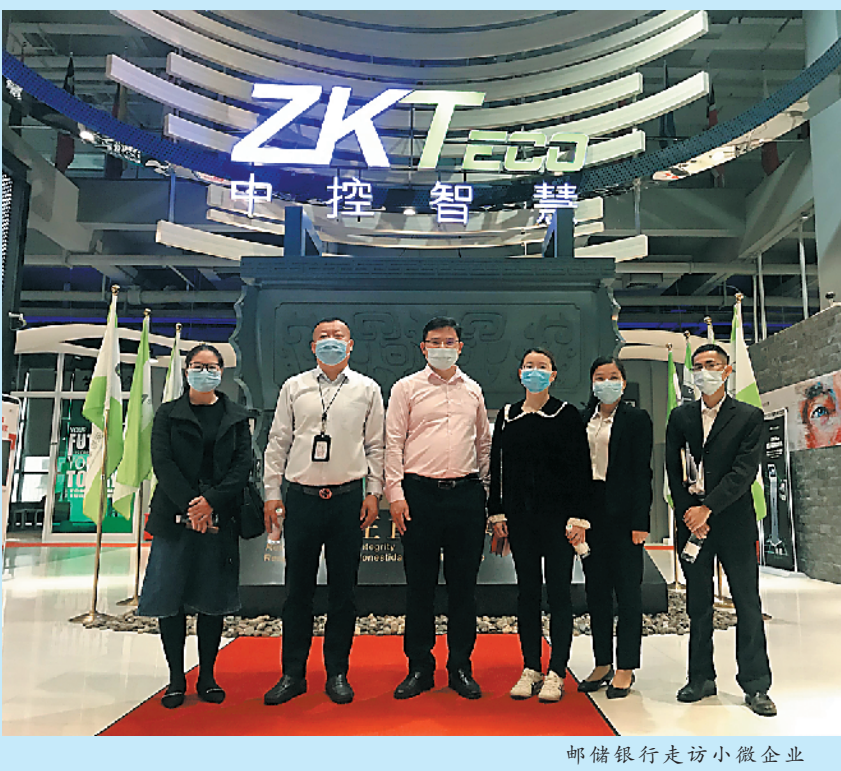
邮储银行走访小微企业

“3月份开工后,客户订单都取消了,厂也快做不下去了。我现在不仅要付房租,还要忙着解决员工工资问题。”黄江一家通信类企业负责人说,随着海外疫情升级,如今企业正面临倒闭的困境。