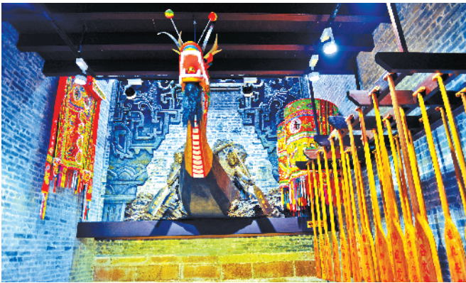
九江镇侨乡博物馆内设有各种岭南传统文化元素展示厅

值得注意的是，消费者使用三水消费券期间如遇退单或退款情况，退款金额以用户实际支付金额为限。当用户使用消费券的交易发生全额退款时，若消费券仍处于有效期内，消费券退还至用户微信卡包，用户可继续使用该消费券；当用户使用消费券的交易发生部分退款时，无论消费券是否处于有效期内，消费券不退回。三水消费券自领取之日起10个自然日内有效，具体以券面显示为准，过期无法使用，不能转让、转售、转赠，不兑现，伪造或变造无效。