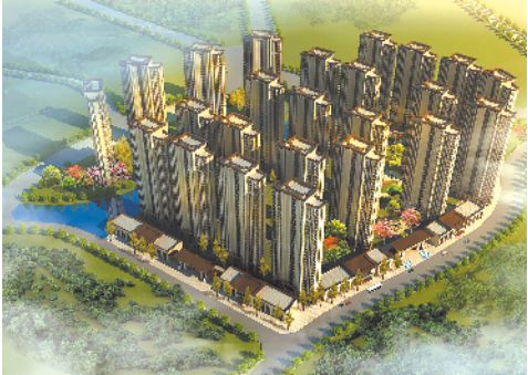
西樵镇联新染厂片区改造项目的商住项目效果图

的规划，联新染厂片区项目位于山北片区，片区首期开发区域约600亩，包括联新染厂片区202亩的商住项目，及400亩的产业项目。西樵镇镇长杨明表示，西樵镇联新染厂片区改造项目对镇内其他村居的村改项目有重要的示范作用。接下来，西樵要加快山北片区的规划和招商，推动成型，抓住村改窗口期，为群众创造良好的生活和经济环境。