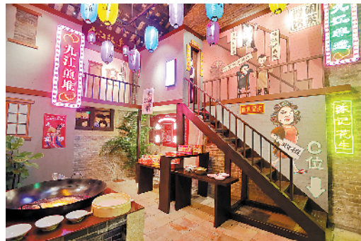
奇趣非遗馆内设有九江煎堆展厅