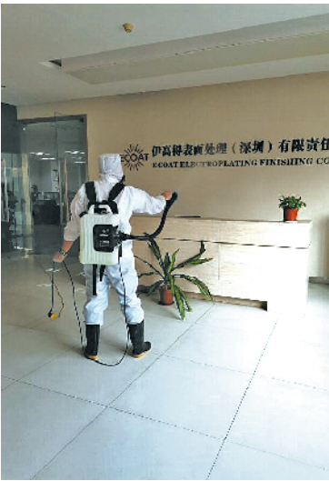
平安产险送免费消毒服务

据悉,平安产险深圳分公司将在深圳相关政府部门的指导下,持续关注疫情进展,履行险企社会责任,携手广大企业共克时艰。