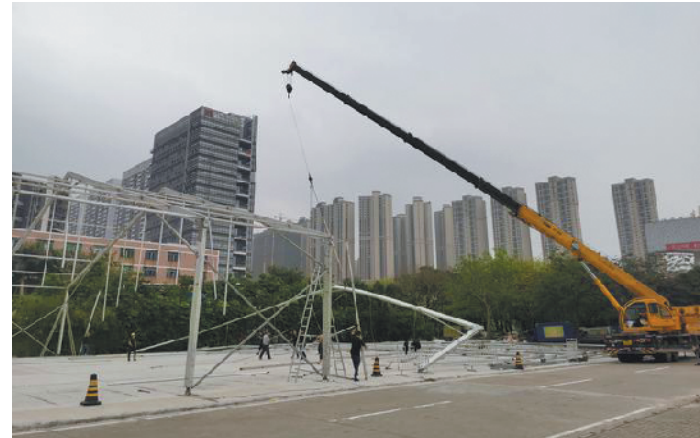
城管执法人员组织施工队拆除岭南明珠东门南侧展厅

“目前,城管部门正进一步探索工地挂点网格员的工作机制,要让网格员发挥更大的桥梁作用,将以往的路面巡查变为源头管控,将被动执法变为主动服务,让工地文明施工问题止步于源头,同时也加强与工地管理方、建设方的沟通协调,上门开展工地文明施工宣传和指导,帮助工地加强自我管理,减少各类不文明施工行为的发生,真正将服务送上门,营造齐抓共管的良好氛围。”石湾城管部门相关负责人表示。