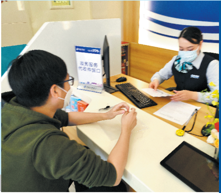
廖先生正在家门口的银行办理政务服务事项

近生活不少的居民。今后,其周边生活的市民,便可以直接在这家网点之中,办理大部分的政务服务事项,并且不需要预约。 据林钦耀介绍,相关网点将会配备2-3名服务督办人员,这些人员都经过专业的培训,对标准化的政务服务十分熟悉。能提供政务咨询导办服务,为企业和群众提供政务服务事项的指尖办理、自助办理、网上办理。并且,银行网点还可以直接代收取审批申请材料,办事人在银行代办服务区提交申请;由银行服务网点代办人员收件并录入政务受理审批系统;并将材料在指定时间内递送到区、镇(街道)行政服务中心,审批完毕后再将办理结果寄送给办事人。