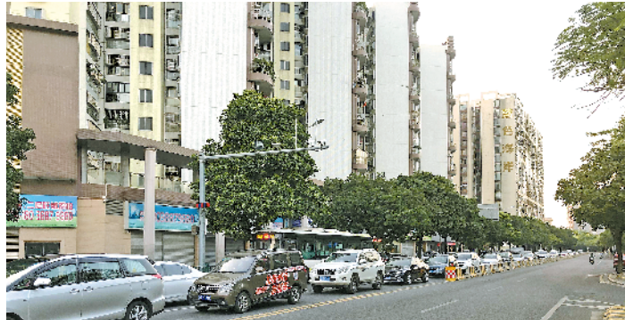
高峰时段桂畔路拥堵严重

据大良环运城管分局相关负责人表示,通过上述改造措施,预计将明显缩短机动车排队长度,缓解桂畔路蓝色海岸路段高峰拥堵情况。据了解,近段时间大良环运城管分局联合交警部门及交通规划专业研究机构,通过优化人行过街设施、拓宽右转车道、设置单向待行区等措施对多个节点(路段、区域)交通组织进行了全面优化,改善工作日早晚高峰期及重大节假日期间交通通行效率。