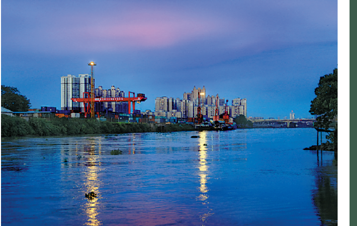
广东（石龙）铁路国际物流基地