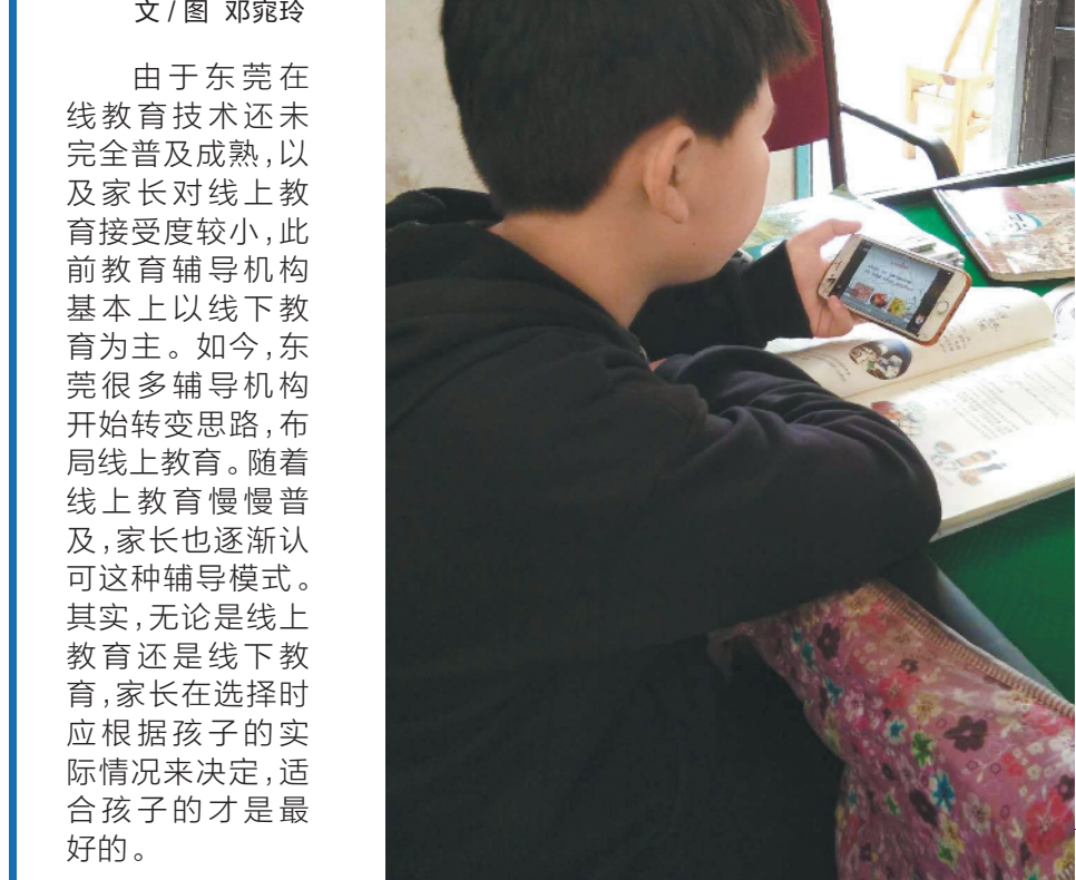
文 / 图 邓宛玲

由于东莞在线教育技术还未完全普及成熟，以及家长对线上教育接受度较小，此前教育辅导机构基本上以线下教育为主。如今，东莞很多辅导机构开始转变思路，布局线上教育。随着线上教育慢慢普及，家长也逐渐认可这种辅导模式。其实，无论是线上教育还是线下教育，家长在选择时应根据孩子的实际情况来决定，适合自己的才是最好的。