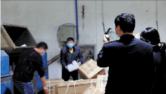
执法人员监督仿冒品集中销毁过程

佛山海关驻南海办事处建立了知识产权关企联络员制度,指定专人负责重点企业的日常联络和定期走访,对跨国品牌公司知名品牌、本土出口知识产权优势企业实施重点保护,增强企业在华投资信心,提升国内企业创新及维权能力。同时该办还通过开展内部业务专项培训,指导现场关员辨别疑似侵权商品,提升关员办案能力。今年以来,该办已累计查获5宗涉嫌侵权案件,查获涉嫌侵权货物数量3.4万余件、案值46.5万元人民币。在案件查发数量和案值上均已超越2019年全年。