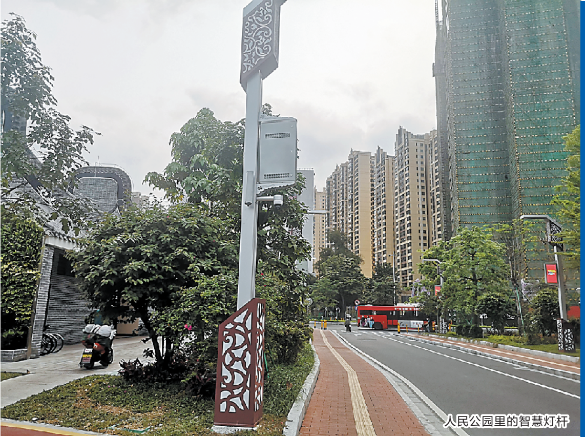
人民公园里的智慧灯杆

搭载的灯杆倾斜监测装置,可监测由于地面沉降、撞击带来的震动,发生灯杆倾斜趋势和危险时第一时间通知人员前往现场确认,防止事故的发生。此外,