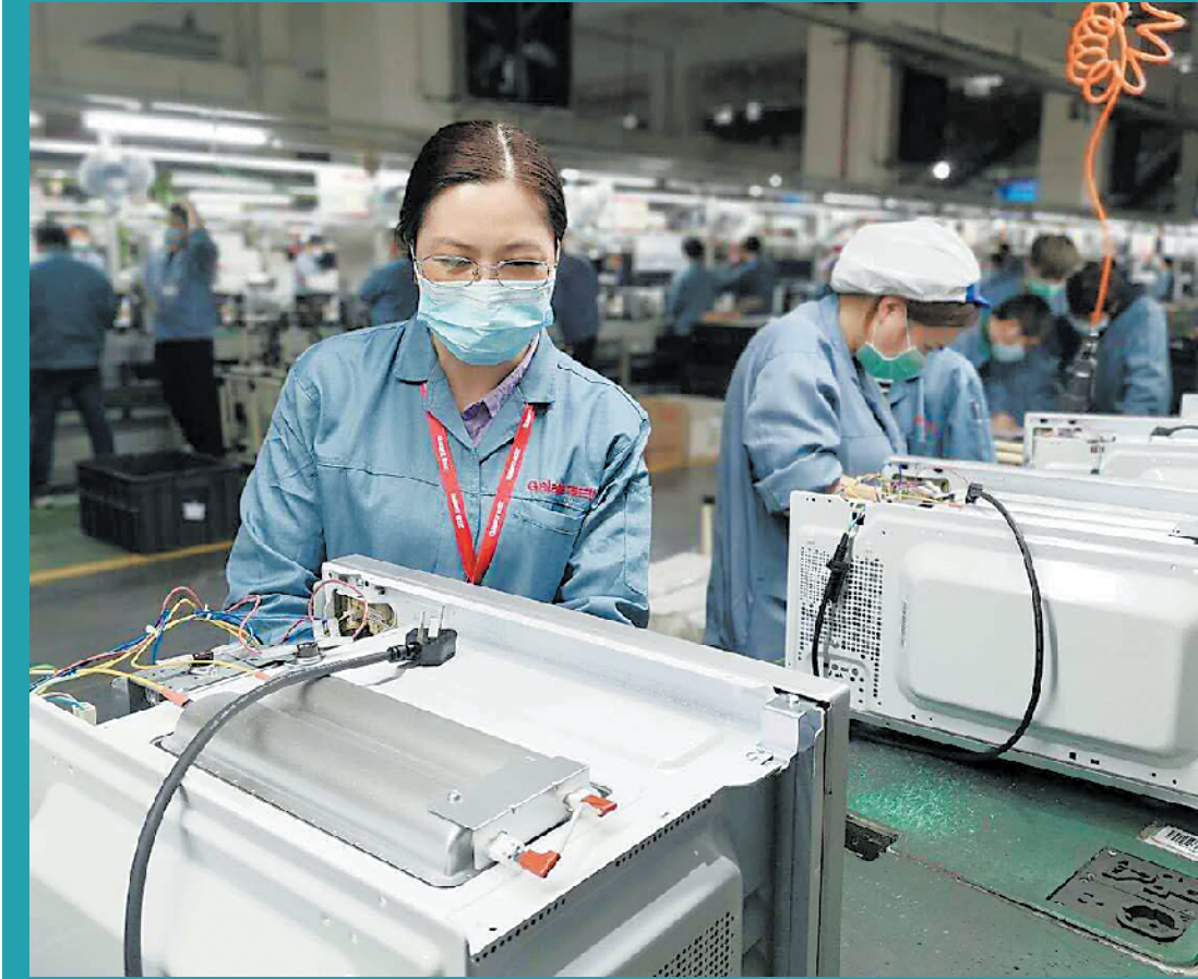
格兰仕工人在生产线上加紧工作

记者了解到,据企业复工复产情况调查问卷统计,预计二季度用工总需求减少和行业需求分化并存,在经济形势不明朗和市场需求萎缩的情况下,企业将降低用工招聘力度、缩减员工规模。其中服务业经营面临压力较大,用人需求将继续收窄。不过,基于顺德村级工业园改造攻坚