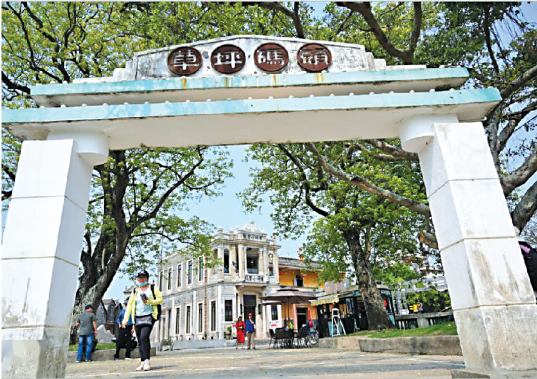
台山市水步镇草坪村成为江门新的乡村游景点