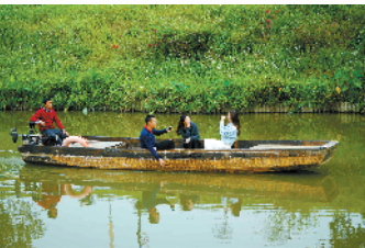
游人在古劳水乡乘船游览

目前，江门疫情风险降低，加上五一假期临近，市民出游欲望大大增强，这让业界对文旅行业复苏充满信心。记者 28 日也从江门市文广旅体局获悉，为加速文旅产业消费复苏，江门印发了《江门市促进文旅产业复苏和发展的若干措施》（下称《措施》）。《措施》从文旅企业帮扶行动、文旅供给侧建设行动、文旅品牌营销行动、新业态促消费行动、产业振兴保障行动五个方面着手，推出 30 条具体措施，为整个旅游行业注入了一剂“强心剂”。