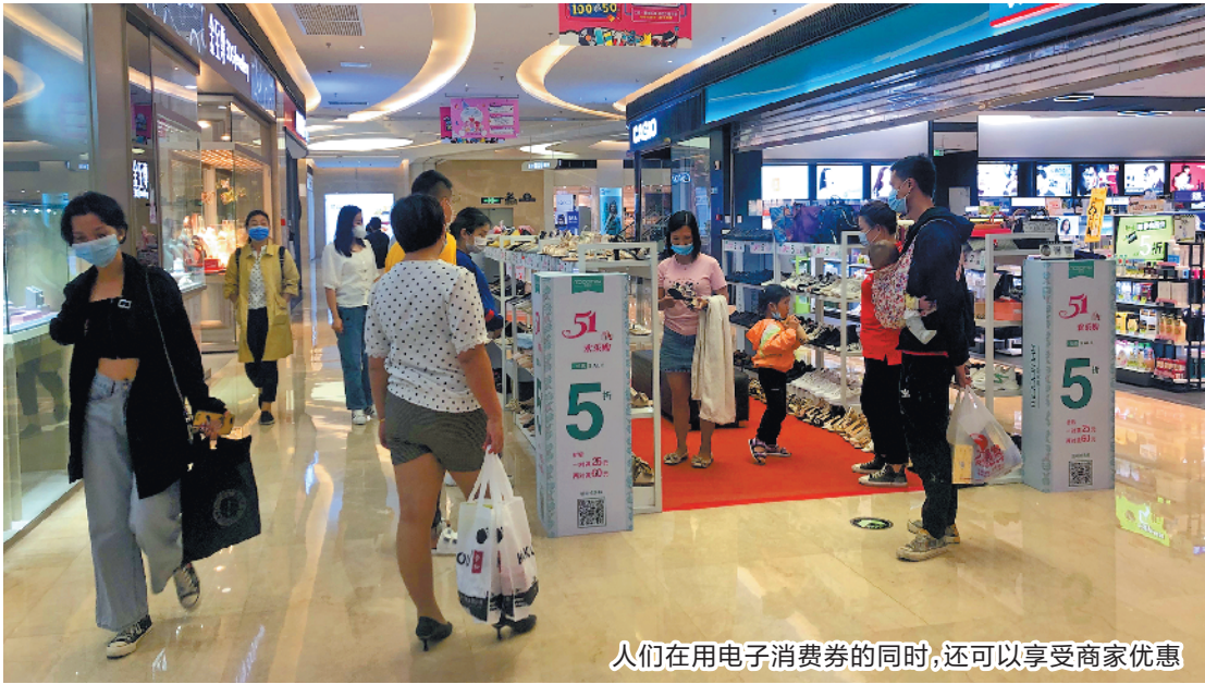
人们在用电子消费券的同时，还可以享受商家优惠

不过，这一点对于游客来说稍微有点不友好。首先必须要定位在珠海才能预约报名领取，这就要求游客在登记预约之际要在珠海，或者由珠海的亲朋好友帮忙登记预约。本次活动相关负责人表示：“因为活动涵盖了五一黄金周，我们在 5 月 1 日当天会有有一次抽奖，而且五一期间有满额送券，这样游客还是很有机会获得这次补贴的。”