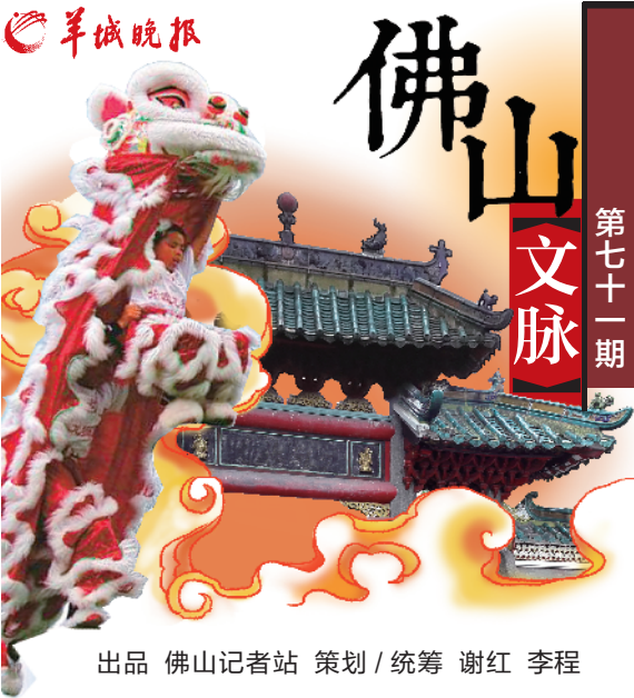
出品 佛山记者站 策划/统筹 谢红 李程