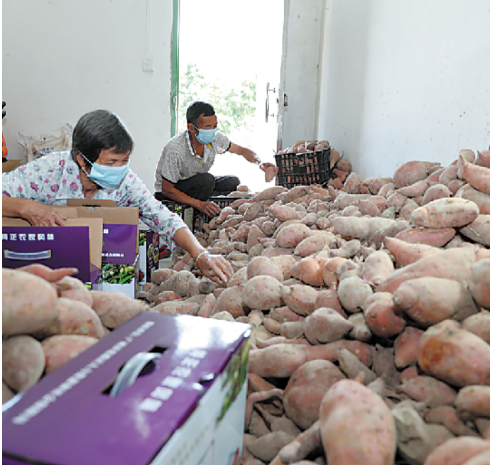
黄沙坑村农家番薯如期迎来丰收季,村民正在一箱箱打包发货