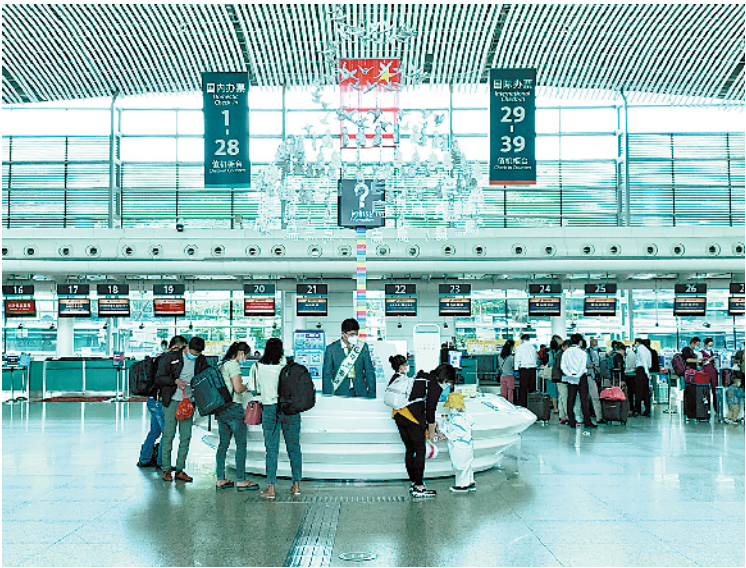
揭阳潮汕国际机场“五一”小长假共接送旅客近4万人次

“受新冠肺炎疫情影响,今年的‘五一’小长假客流较往年略有减少,但呈现出逐步回暖趋势。”据揭阳潮汕国际机场工作人员介绍,该机场于5日出现了一个客流小高峰,当日共保障进出港航班99班,航班量创疫情暴发以来新高,预计接送旅客近1.1万人次,客流方向主要集中在南京、上海、昆明、杭州、重庆、成都、海口、西安、郑州等重点城市。