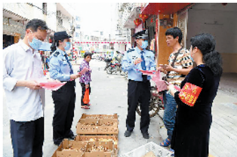
志愿者宣传反诈知识

“防范就是最好的打击。我们派出所把辖区其他村(居)委的干部、各中小学负责人和一些社会贤都争取加入到反诈宣传队伍中来,以点带面串珠成链,组建超百人的反诈宣传志愿队伍,采取网上网下同时发力,让宣传活动到村到户家喻户晓,提升辖区群众反诈意识,筑牢防范电信网络诈骗的‘铜墙铁壁’,全力守护群众的‘钱袋子’。”双头派出所所长钟剑华如是说。