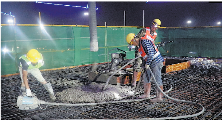
工人们正在紧张施工

据介绍,待场馆的主体结构完成封顶施工后,这座“飞舞浪花”造型的主场馆就将全面转入二阶段的钢结构吊装及室内二次结构施工阶段,项目的会议中心、训练场和室外大平台等附属工程目前也正在进行基础施工,为主体结构施工和一体化建设