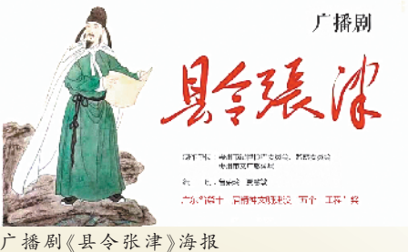
广播剧《县令张津》海报