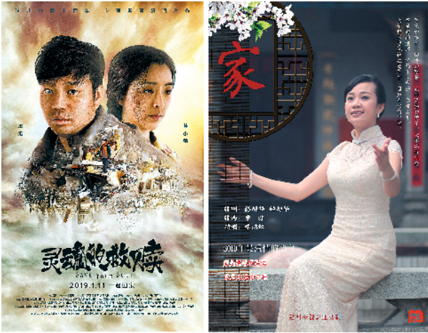
电影《灵魂的救赎》海报