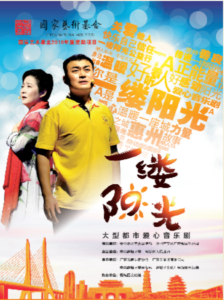
戏剧《一缕阳光》海报