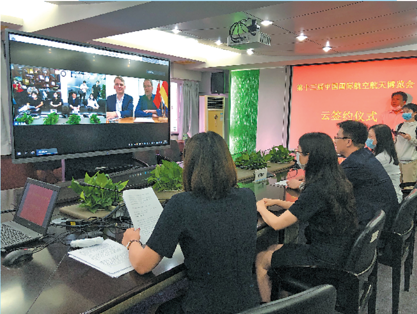
第十三届中国国际航空航天博览会首场“云签约”活动现场

万丰飞机工业有限公司是万丰航空工业有限公司下属企业,以飞机研发制造为核心。目前万丰航空工业有限公司在全球拥有三个飞机制造基地(中国、奥地利、加拿大),三个飞机设计研发中心(奥地利、加拿大、捷克),一个在建飞机制造工程中心(中国),为全球各飞机制造基地提供有力的技术保障和售后服务。其中国内制造基地厂房面积约10万平方米,现已完成一期年产500架通用飞机的产能建设。第十三届中国航展,该公司已确定551平方米的室内特装展位,并将展出10架钻石系列通用飞机。