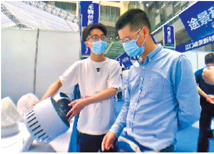
江门高新区(江海区)举办消费节活动

作为江门市区最新的一座商业综合体,江海万达广场目前正在加紧建设。而该项目也被纳入了《若干措施》当中。据悉,江门市提出要