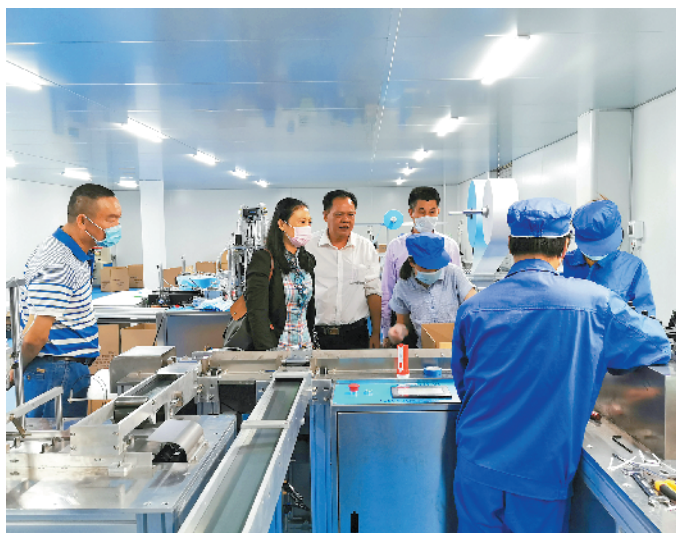
3月，南海区退役军人事务局走访退役军人创办企业复工复产情况

南海区退伍军人事务局将从征集的线索中选出20位退役军人创业者，把他们的事迹向社会分享，开辟线上投票渠道，组织线下评选，综合线上线下分数，评选出10位优秀退役军人创业者。10-11月，该局将组织一场线下故事分享会，邀请10位优秀创新创业退役军人，与年轻退役军人面对面分享，鼓励年轻一辈要自信自强，树立对国家经济向好发展的信心。