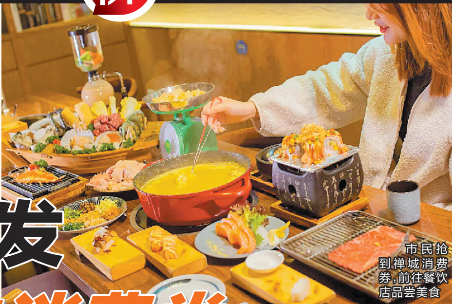
市民排队到禅城消费券，前往餐饮店品尝美食

据介绍，此前借助电子消费券的派发，禅城辖区的餐饮行业逐渐回暖，此次“家用电器消费节活动”或将让家电销售行业实现升温，进一步拉动内需，让市民能以最优惠的价格，购买到心仪的家用电器，实现消费服务业的全面复苏。