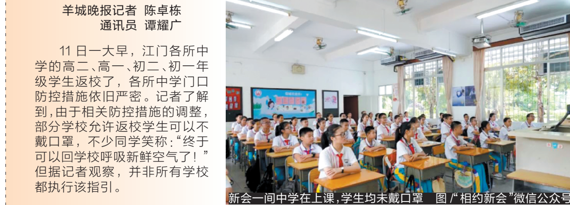
新会一中中学在上课,学生均未戴口罩

记者11日一大早走访江门市区各中学时看到,各学校基本按照此前高三、初三学生返校时的流程进行安排。如在培英高中,学生们到达校门口时均把行李放到后门,由学校工作人员代为推进校园消毒;学生们则在校门口外的人行道上间隔排队,手持健康证明等待测量体温,进校后消毒双手再去取行李。据悉,培英高中的高二、高三学生有2000多人,11日采取了分批返校的方式,在上下午陆续回到学校。 但与之前高三、初三的师兄师姐们返校后仍需佩戴口罩不同,11日返校的一些高二、高