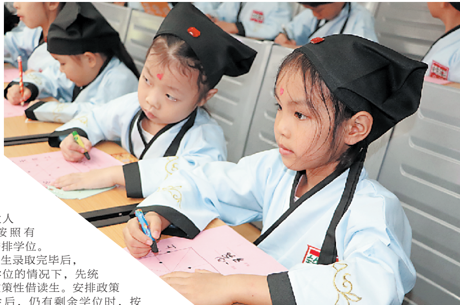
小孩子在学写字(资料图)

此外,顺德将落实顺德户籍适龄残疾儿童少年入学“零拒绝”和“全接纳”。各镇(街道)教育局要按照残联部门提供的适龄残疾儿童少年实名制登记资料,做好残疾儿童的调查摸底和分类入学安置工作。轻度残疾儿童少年安排入读普通学校,中重度残疾儿童少年安排到顺德区启智特殊教育学校,确实不能到校接受教育的重度残疾少年,安排送教上门服务。