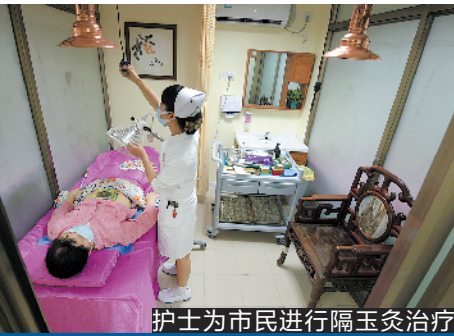
护士为市民进行隔玉灸治疗

据了解，该护理门诊是由省“十三五”中医药重点专科、佛山市中医院治未病中心及护理部强强联合筹建并开展的一个创新性项目，旨在发挥中医护理适宜技术在治未病、保健和慢病管理中的作用。