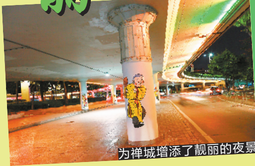
为禅城增添了靓丽的夜景

据禅城城管部门相关负责人介绍，他们利用沿路桥梁及隧道等立体构筑物 and 植物丰富的层次通过灯光展现，在丰富美化佛山