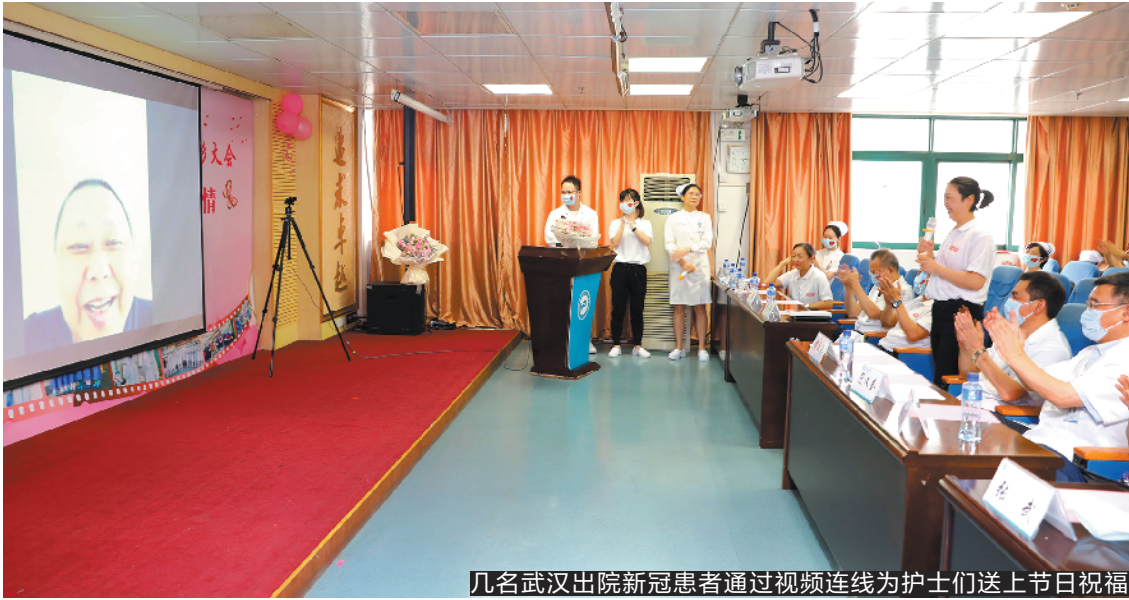
几名武汉出院新冠患者通过视频连线为护士们送上节日祝福

羊城晚报讯 记者张闻、通讯员黄晓晴摄影报道：“我妈妈的健康码已经变成绿码，谢谢你们帮她挺了过来！”今天是第109个国际护士节，在佛山市第二人民医院护士节庆祝大会现场，一场特殊的视频连线感动了在场的医护人员。