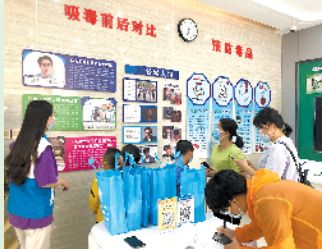
禁毒社工向居民讲解吸毒案例