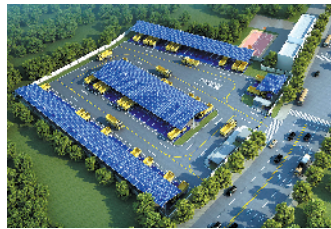
深圳光明公常路充电站效果图