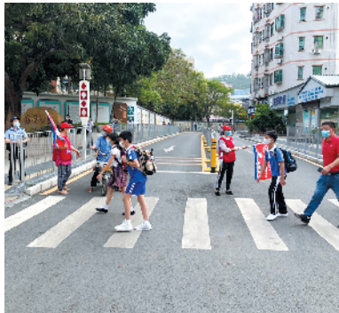
石岩义工为孩子做好交通护航

5月11日,宝安区石岩街道第二批返校复課中小學生挥别“加长版”寒假,重新回到阔别已久的校园。当天,由115名教师义工、家长义工组成的“暖心护航”队伍也早已投入到校园内外的岗位服务中,为辖区学校复學复課注入志愿力量。