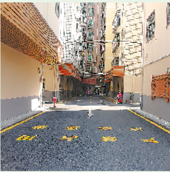
大浪城中村改造全力进行中