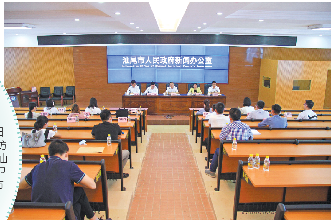
汕尾市政府新闻办举行疫情防控工作新闻发布会,回应社会关切

根据相关安排,5月11日,汕尾市158所学校的初一、初二、高一、高二年级学生共计11万多人也顺利返校复学。而该市的中职学校和小学校生则将于5月18日后陆续返校,涉及学