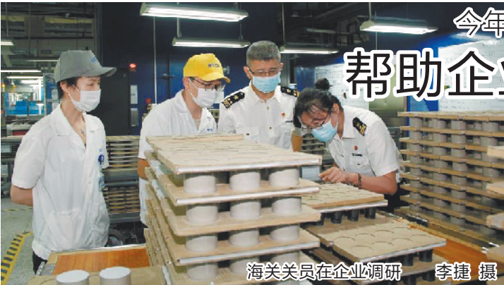
海关关员在企业调研

围,清理现场并上报后恢复营业。该车由于机油管破裂溅出机油滴在排气管上引燃明火。车上连个灭火器也没有,如果在高速路上行驶后果不堪设想。司机对加油员训练有素连忙称赞感激。江门中石化以百日攻坚创效为抓手,强化日常30个预案演练,提升员工应急基本功,遇到危险不乱,按照应急预案程序冷静应对有效处置,最大程度降低了公司和顾客的损失。(熊志)