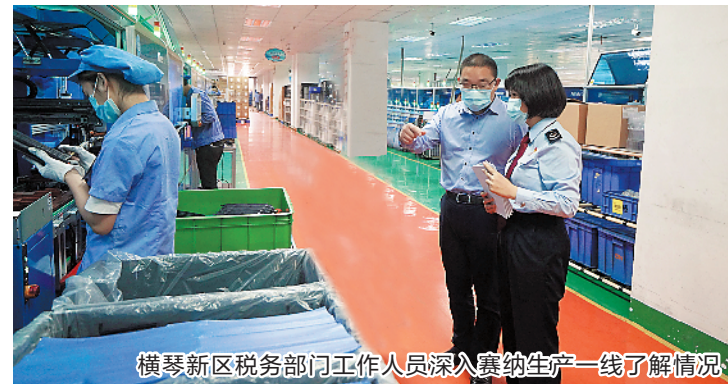
横琴新区税务部门工作人员深入赛纳生产一线了解情况