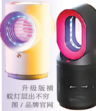
升级版捕蚊灯层出不穷

羊城晚报记者近日走访各大超市发现，目前国内超市销售的绝大多数盘条蚊香、电蚊香片和液体蚊香中的有效成分都是拟除虫菊酯类化合物。作为一种经典的杀虫剂成分，拟除虫菊酯对大部分昆虫有强烈的毒杀效果，对鸟类、哺乳类毒害作用较低，对两栖类、爬行类亦有毒性。