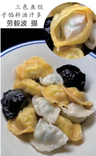
三色鱼饺子馅料汤汁多

“这是船歌牌鲅鱼水饺，当年我在青岛就是吃这个牌子的，这可是青岛家喻户晓的老牌子”