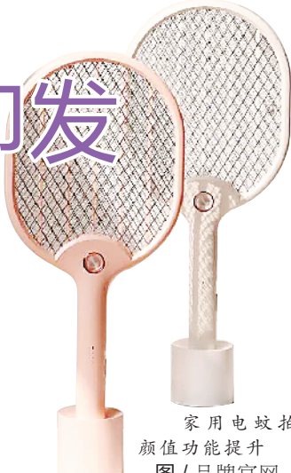
家用电蚊拍 颜值功能提升

天眼查专业版数据显示，我国目前有 1.3 万家生产和销售驱蚊类产品，从地域分布来看，广东省和江苏省的驱蚊相关企业占比超 50%，其中广东省相关企业数量最多，有 3563 家。防蚊产品那么多，究竟哪一种防蚊产品最有效？哪一种又是效果有限没必要花钱购买的？