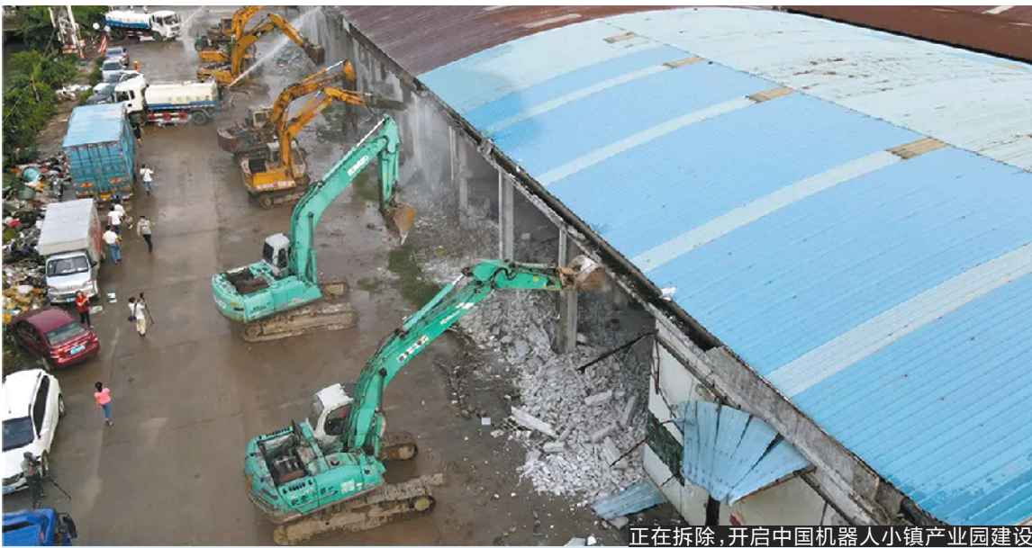
正在拆除，开启中国机器人小镇产业园建设

在此基础上，顺德新增建设1000公里污水管网，分为92个项目包推进。与此同时，顺德计划在年底前完成26个行政村（社区）生活污水处理设施建设，实现205个行政村（社区）全覆盖；在6月底