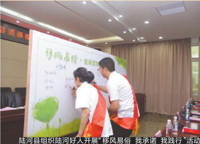
陆河县组织陆河好人开展“移风易俗 我承诺 我践行”活动

洪小姐介绍到，不仅企业招聘的形式由线下转线上，即将入职的新员工也将进行“云培训”，理论课程线上学习的形式也将是员工培训的优化趋势。