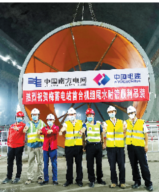
首台机尾水管完成吊装

梅蓄电站位于省内生态功能区梅州市五华县龙村镇，项目建成投产后，将主要承担广东电网调峰填谷、调频调相和事故备用功能，建成投产后，可有效提高火电机运行效率和核电、风电等清洁能源消纳能力，可有效优化电源结构，提高电网安全稳定水平，为广东经济社会可持续发展提供有力保障，同时还加快推进梅州的绿水青山转换成金山银山的步伐，助力梅州广东发展。另外，项目建成后，每年还可节约标准煤消耗，减少二氧化碳、二氧化硫及粉尘排放，有利于节能减排、保护环境，助力推进建设绿色广东、美丽广东。