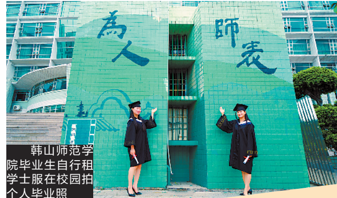
韩山师范学院毕业生自行租学士服在校内拍个人毕业照

校，再自行租学士服，三两好友一同拍下毕业照做留念。 据了解，韩山师范学院今年毕业手续全部在线上办理，为弥补毕业生的遗憾，学校准备开展“绘生汇影——你们班的毕业合影，学校帮你做”活动，为毕业生定制集体毕业照，每个学院也将为毕业生举办专属的“云毕业”特色活动，如筹划毕业祝福接龙活动，拍摄具有学院办学特色的专题MV送给毕业生等。