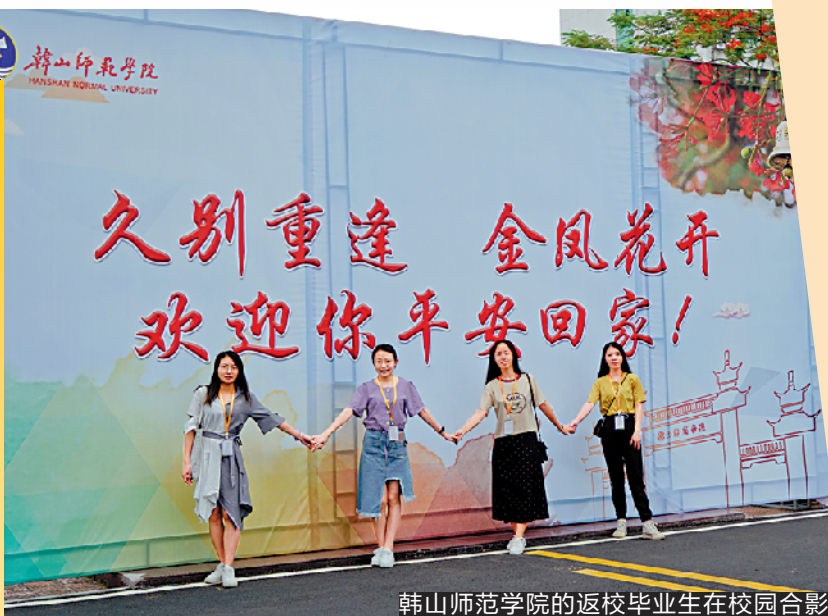
韩山师范学院的返校毕业生在校园合影

“云毕业”虽然遗憾，但对学子来说是一个难忘的经历。本次毕业季，记者走访了汕头大学和韩山师范学院，从学校、学生、企业多个视角关注今年的毕业季。