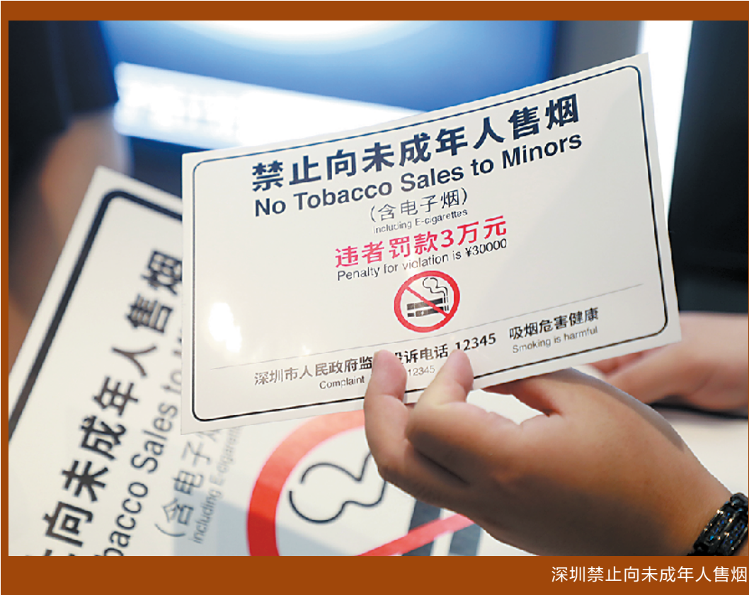
深圳禁止向未成年人售烟

“调查中发现青少年吸烟者戒烟的意愿也非常强烈，但获得规范的戒烟服务比例低。”熊静帆指出，过去30天内吸过卷烟的学生中，其中自述曾经尝试过戒烟的比例为63.1%，现在想戒烟的比例为46.6%，仅有13.3%的现在吸烟者报告，接受过来自于有组织的戒烟活动或专业人员的戒烟建议。“这说明我们需要加强城市戒烟服务能力建设，开发符合青少年需求的、可及的戒烟服务和戒烟项目。”