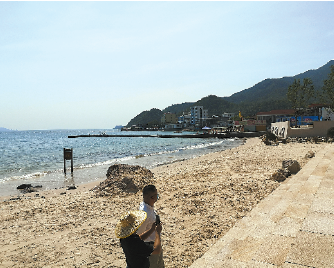
东部海堤重建不断推进

接下来,南澳将继续加大工作力度,加快推进项目涉及的其余区域的征拆谈判。