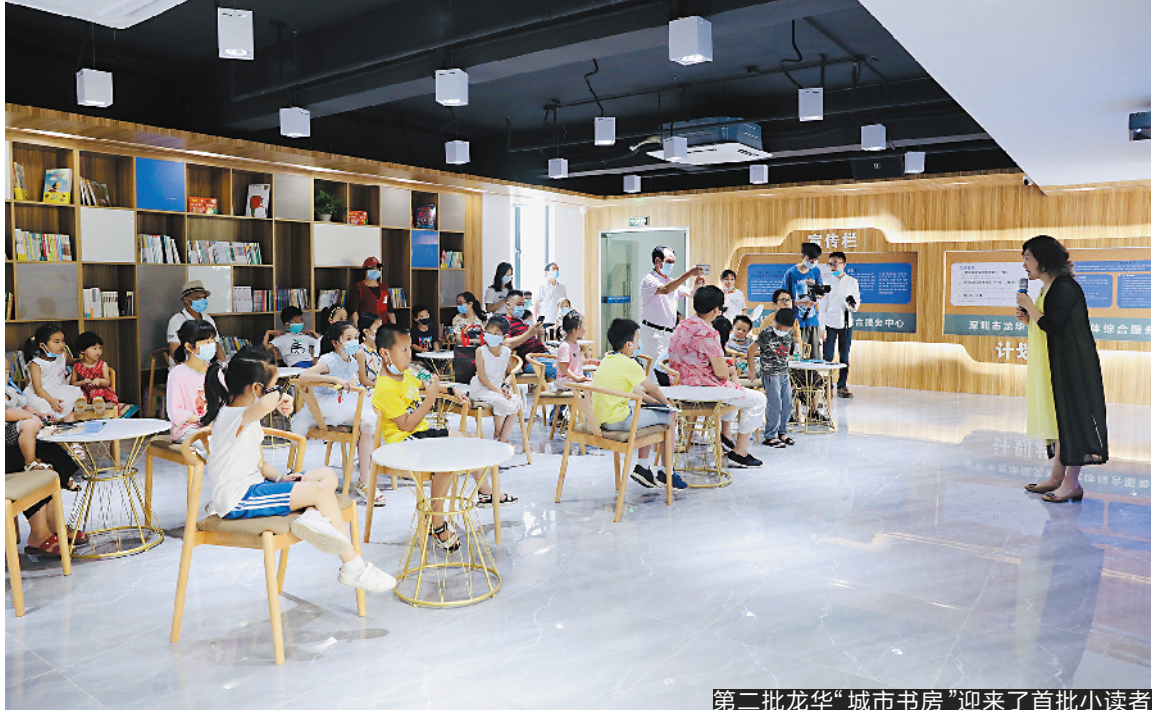
第二批龙华“城市书房”迎来了首批小读者

龙华区第二批“城市书房”启用,将定期举办各项文化活动 年底前将建成10个“城市书房”