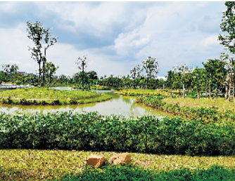
鹅颈水湿地公园生态环境整洁优美,是周边居民休闲娱乐的好去处

保节能相关常识,呼吁居民积极行动起来,从现在做起、从自身做起,树立绿色消费观念,养成文明生活习惯,节能节水节电,保护环境资源,共同改善生态环境质量。被采访的居民普遍表示,环境保护,人人有责。要从身边一点一滴的小事做起,讲文