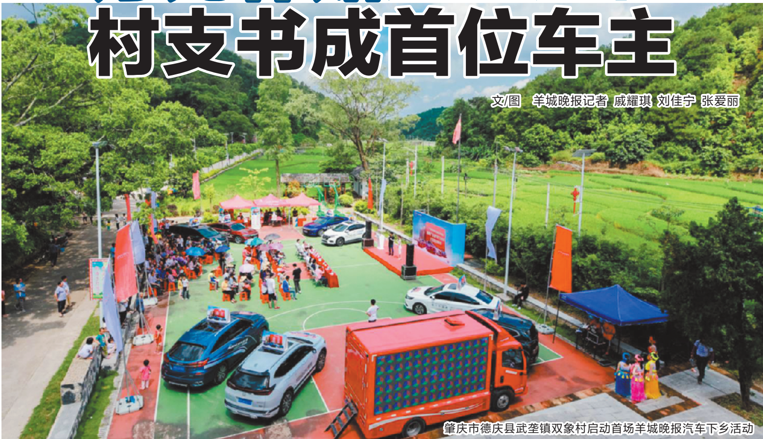
肇庆市德庆县武垄镇双象村启动首场羊城晚报汽车下乡活动